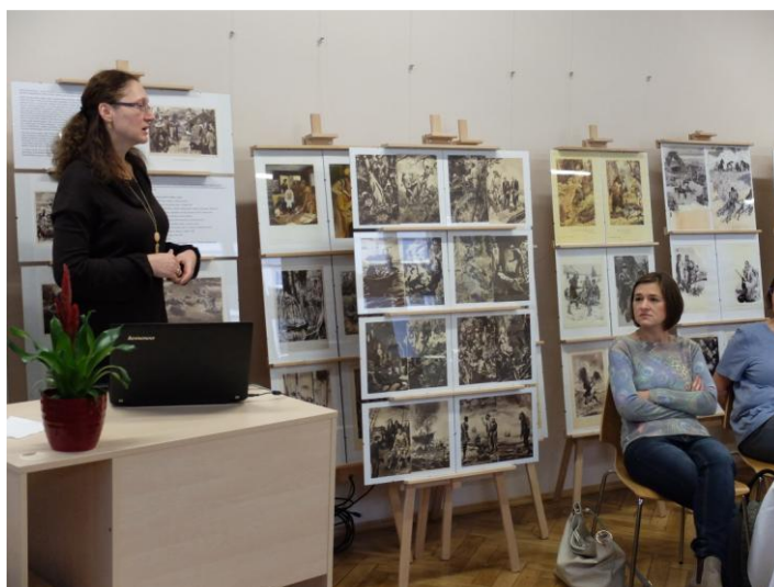
Podzimní setkání knihovníků v Městské knihovně Poděbrady

V první polovině roku jsme vyvolali několikrát jednání se zastupiteli obcí (např. Lužná, Svojetín, Roztoky u Křivokláta, Braškov, Řisuty, Ruda, Rynholec, Tachlovice ad.), kde jsme cíleně konzultovali zlepšení podmínek. Řada knihoven tak nasměrovala svoji činnost k moderní knihovně 21. století. Druhá polovina roku patřila i přípravě prostředí k realizaci stěžejního projektu RF regionu Kladno, tj. zavádění zkušebního provozu knihovnického systému pro obecní knihovny v našem regionu, které nemají vlastní systém.