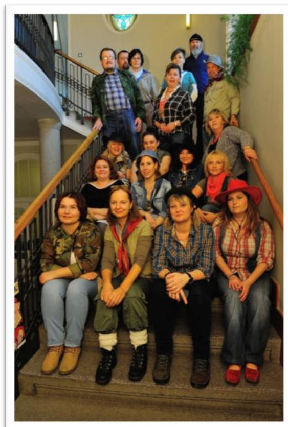
Den Středočeského kraje – zaměstnanci knihovny v roli trampů