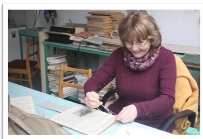
Práce v knihařské dílně