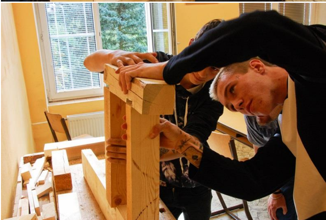
Studenti SOU Kladno-Vrapice při výrobě nábytku, září 2018