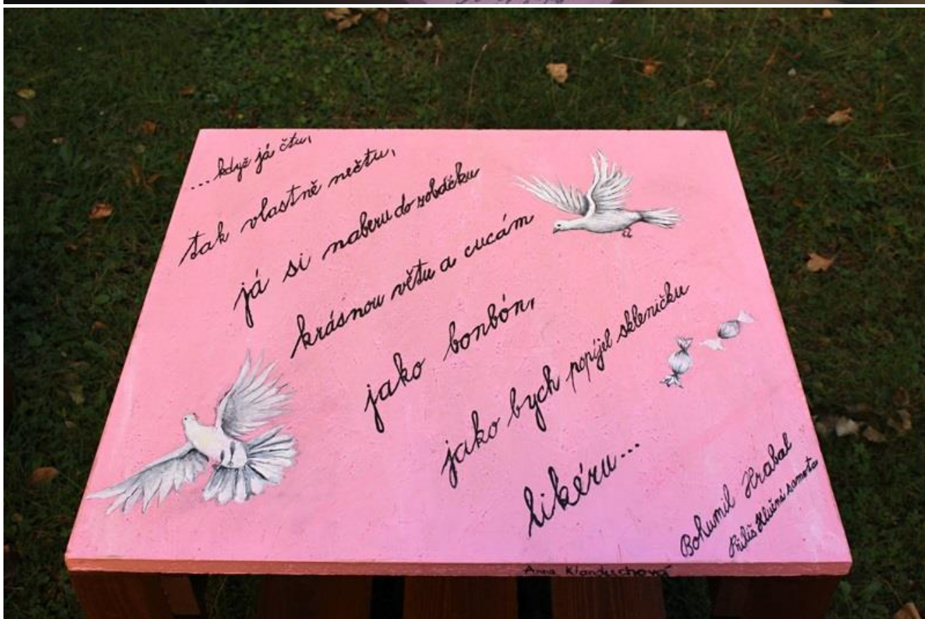
Studentky ZUŠ Kladno, 5. května, při výtvarném zpracování desky stolku a její výsledná podoba, září 2018