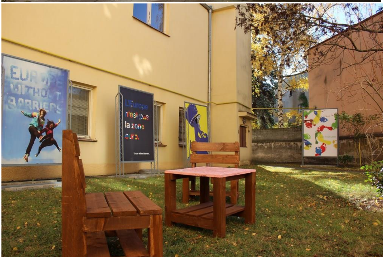
Posezení před knihovnou a ukázka výstavy Evropa bez bariér, říjen 2018