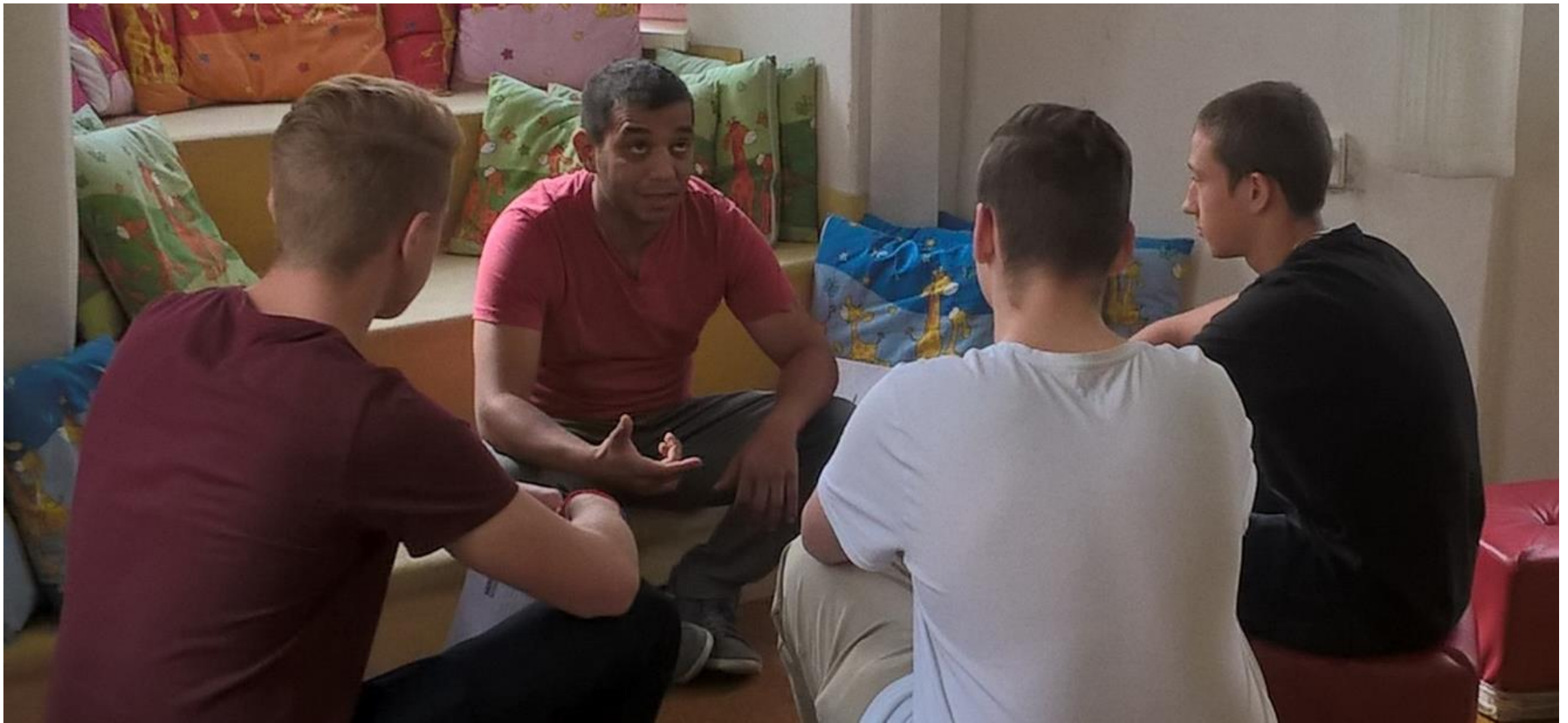
Chodov, září 2017