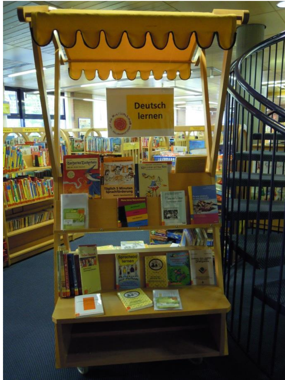
Frankfurt nad Mohanem