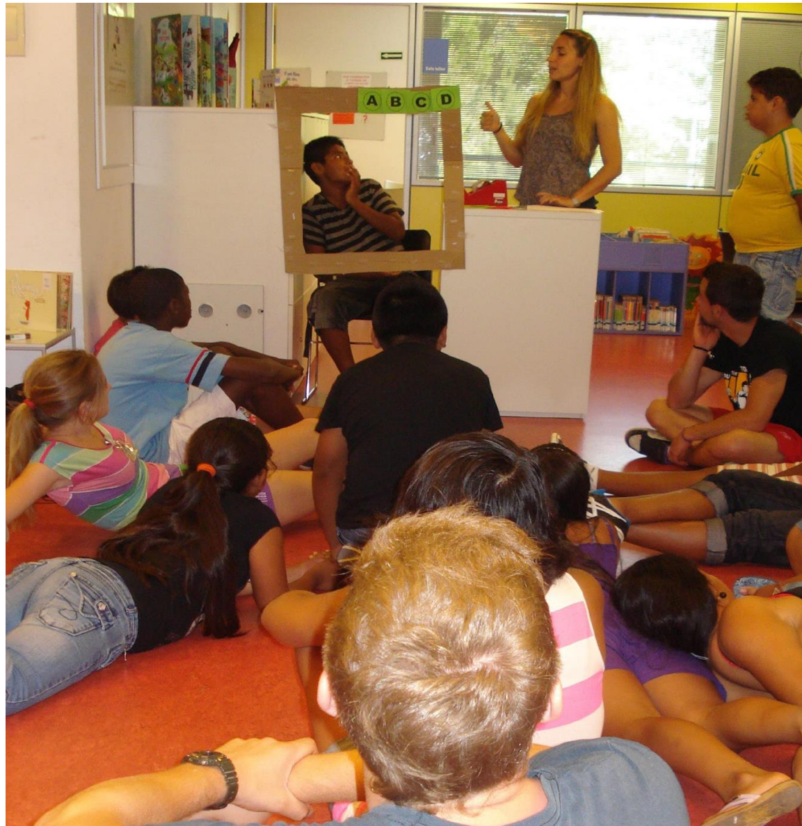
Barcelona – Bon Pastor