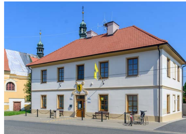
↑ Chotusická knihovna sídlí v budově obecního úřadu

Určitě si toho velmi vážím, ale přiznám se upřímně, že vlastně o tom moc nevím, takže ani nevím, na základě jakých kritérií jsem k tomuto ocenění byla vybrána.