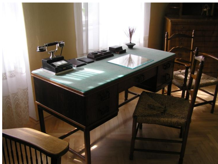
Pracovna Karla Čapka 📖