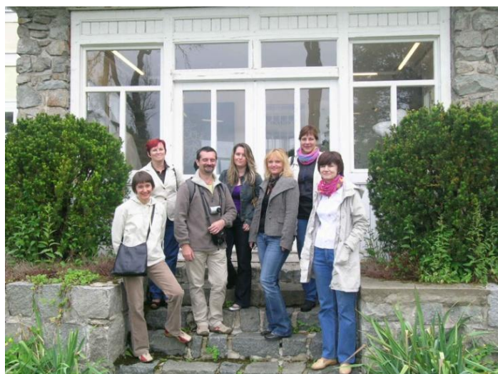
Účastníci zájezdu 📖