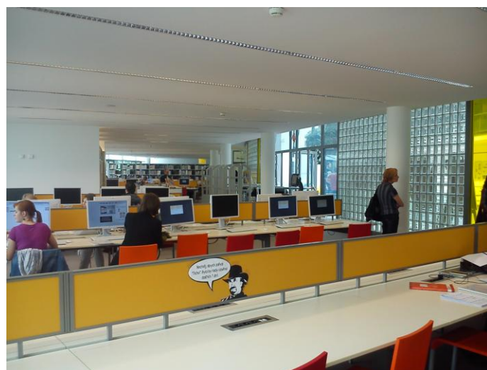
Knihovna Univerzity Tomáše Bati ve Zlíně

Dne 7. května proběhla exkurze pracovníků SVK v Kladně v Knihovně Univerzity Tomáše Bati ve Zlíně a v Krajské knihovně Františka Bartoše v témže městě. Knihovna UTB sídlí v nově postavené budově, kterou sdílí např. s rektorátem této univerzity. Knihovna Františka Bartoše našla své nové místo ve zrekonstruované budově bývalé Baťovy továrny. Obě jsou to knihovny moderní, prostorné, které nabízejí, podle svého zaměření, různorodé kvalitní knihovnické služby. Tyto prostorově velkorysé knihovny jsou mimo jiné