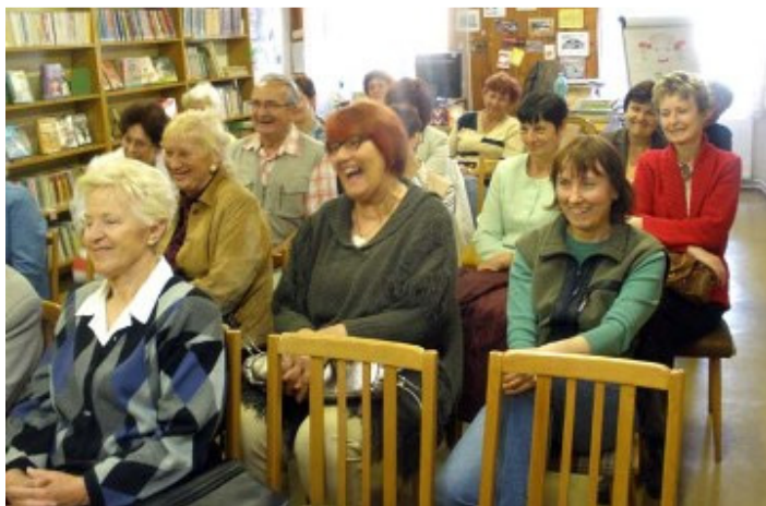
Čtenáři na besedě v MěK Velvary 12.5.2010