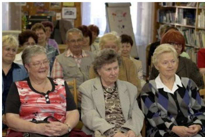
Čtenáři na besedě v MěK Velvary 12.5.2010