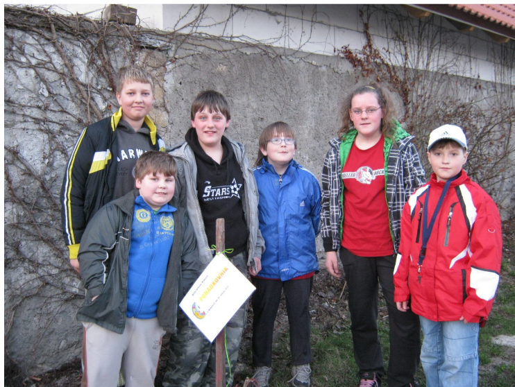
Malí čtenáři miskovické knihovny