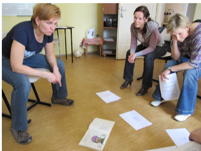
Knihovnice na semináři

Druhá skupina knihovnic si mezitím „hrála“ s pohádkami. Hledaly chyby v pohádkovém příběhu, při hrách inspirovaných pohádkami cvičily svůj postřeh, rychlost a hmat. Vyzkoušely si také slovní hry – např. vymýšlení pohádky postupně několika autory. Potom také kreslily pohádkové postavy a ostatní je měly uhodnout. Zajímavou zkušeností a zároveň tipem pro práci s dětmi a pohádkou bylo jmenování detailů z ilustrace k pohádce, kterou na několik minut lektorka všem ukázala. V další části se skupiny vystřídaly. Během semináře zbyl čas také na výměnu vlastních zkušeností a drobných postřehů z praxe. K radosti lektorek z Labyrintu odcházely knihovnice ze semináře opravdu spokojené :o)