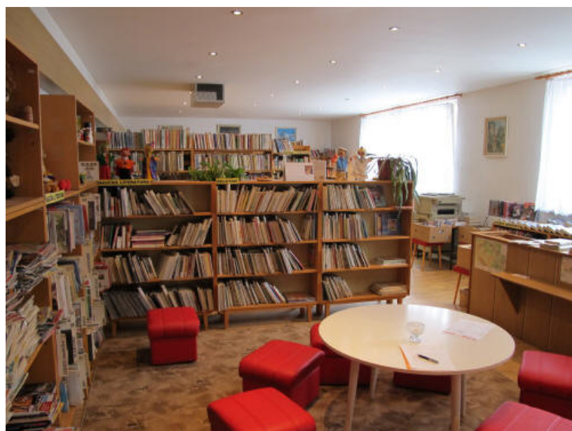
Pohled do Obecní knihovny Křiževice