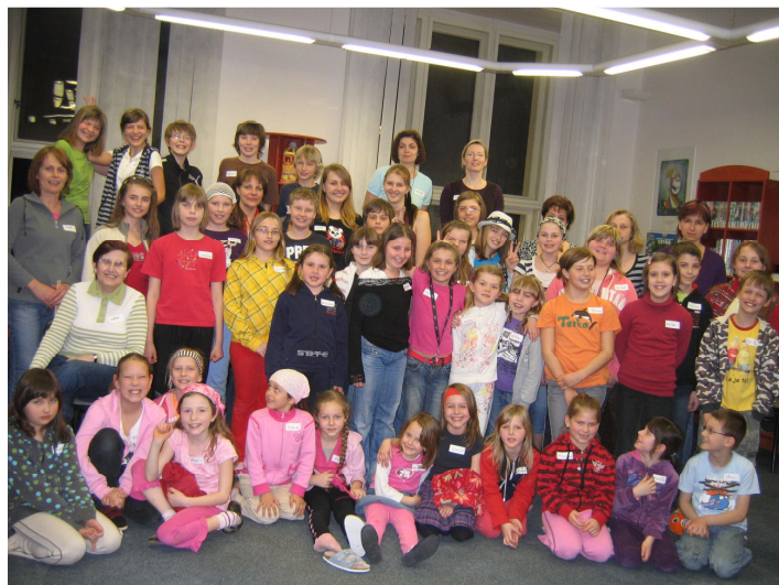
Účastníci Noci s Andersenem