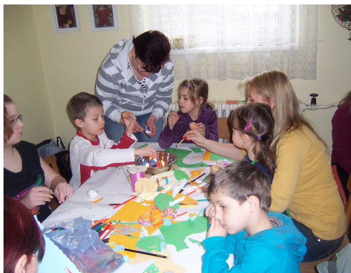
Děti při výrobě velikonočních dekorací