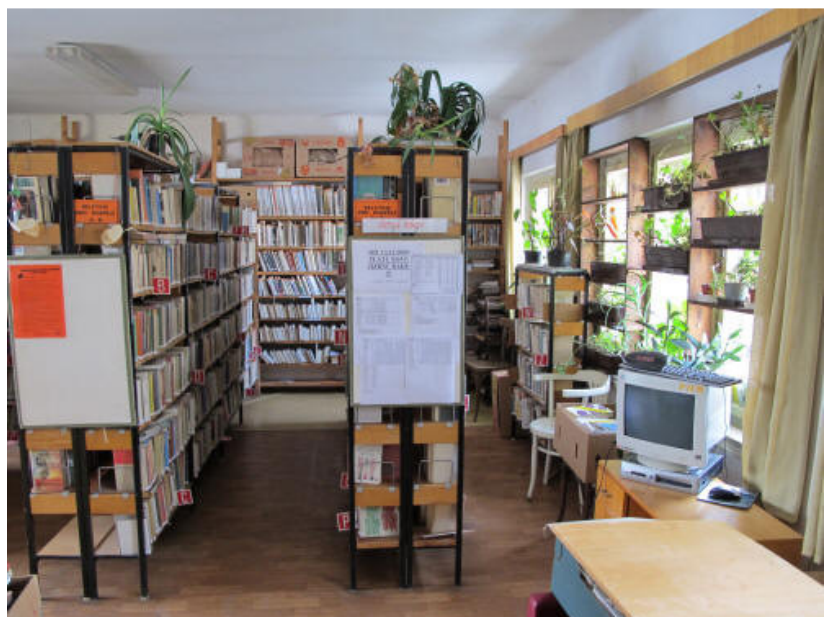
Obecní knihovna Stříbrná Skalice