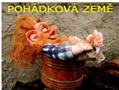
Z výstavy Potulná pohádková země