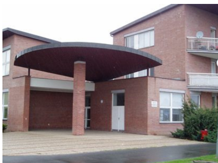
Místní knihovna v Obříství

Knihovna získává Diplom za vzorné vedení obecní knihovny spojený s finanční odměnou. V letošním roce 2010 získala ocenění Obecní knihovna Dymokury (770 obyvatel, http://knihovna-dymokury.webnode.cz/ ). Tato knihovna razantně rozvíjí svou činnost, ale současné výsledky zatím nestačí na nominaci do republikového kola soutěže Knihovna roku. Požádala jsem proto metodičky z pověřených knihoven, aby mně a SVK v Kladně vytipovaly některé knihovny, které mají zajímavou činnost a měly by zájem zúčastnit se této prestižní soutěže.