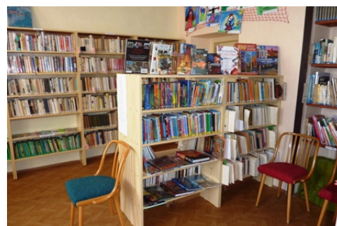
Místní knihovna Mělnické Vtelno

Soutěž KNIHOVNA ROKU má několik úskalí. Bohužel, jako vždy, jde v první řadě o peníze. Prvním limitem jsou finanční náklady na organizaci republikové hodnotitelské komise. Z těchto důvodů je mezi kraji dohoda, že z každého kraje by měla být do republikového kola navržena pouze jedna knihovna. Druhým limitem (a sporným bodem) je počet obyvatel obce, který je stanoven podle největší obce v ČR a to 5 250 obyvatel. Takže soutěží knihovny (profesionální i neprofesionální), které mají od základu různé podmínky k práci.