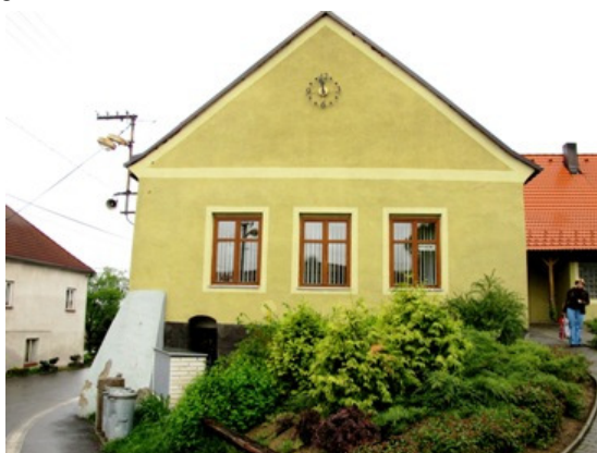
Městská knihovna Trhový Štěpánov

Soutěž KNIHOVNA ROKU má několik úskalí. Bohužel, jako vždy, jde v první řadě o peníze. Prvním limitem jsou finanční náklady na organizaci republikové hodnotitelské komise. Z těchto důvodů je mezi kraji dohoda, že z každého kraje by měla být do republikového kola navržena pouze jedna knihovna. Druhým limitem (a sporným bodem) je počet obyvatel obce, který je stanoven podle největší obce v ČR a to 5 250 obyvatel. Takže soutěží knihovny (profesionální i neprofesionální), které mají od základu různé podmínky k práci.