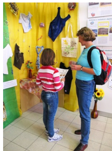
Milá návštěva paní knihovnice z Čelákovice

Polabský knižní veletrh v Lysé nad Labem představil i kopii slavné Ďáblovky bible, sedmdesát osm kilogramů vážící knihy, která obsahuje 624 stran textu na pergamenu. Vznikla v klášteře v Podlažicích u Chrastí kolem roku 1229.