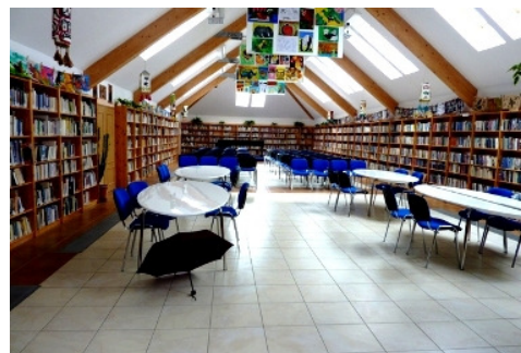
Vzorná lidová knihovna ve Velkých Popovicích

Všechny vytipované knihovny jsou aktivní hybatelky kultury ve své obci, ale drobnosti (např. krátká výpůjční doba; knihovna bez automatizovaného výpůjčního protokolu, chybějící prostory pro akce apod.), které se nezdají až tak důležité z našeho pohledu, by pravděpodobně hendikepovaly naše knihovny oproti ostatním soutěžícím knihovnám. Nakonec jsme nominovaly Vzornou obecní knihovnu Velké Popovice.