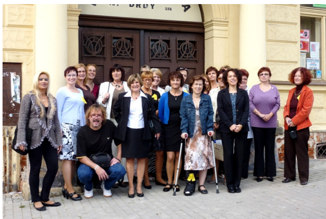
Kolektiv knihovníků příbramské knihovny