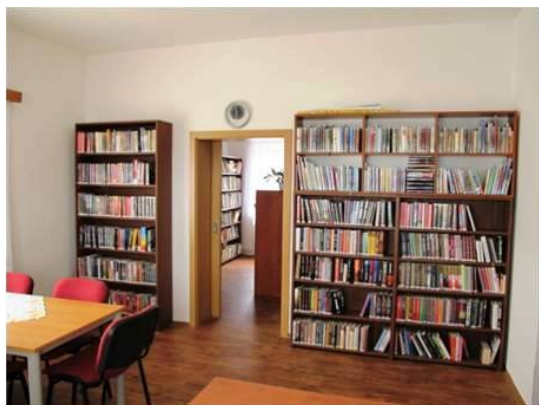
Interiér knihovny ve Vysoké