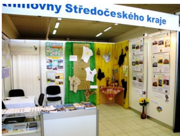
Stánek Středočeské vědecké knihovny v Kladně

Na výstavní ploše knižního veletrhu se sešlo 37 vystavovatelů - nakladatelů, knihkupců, nechyběli antikváři, ilustrátoři a instituce zabývající se knižní kulturou. V doprovodném programu se představili spisovatelé a básníci v besedách a autogramiádách.