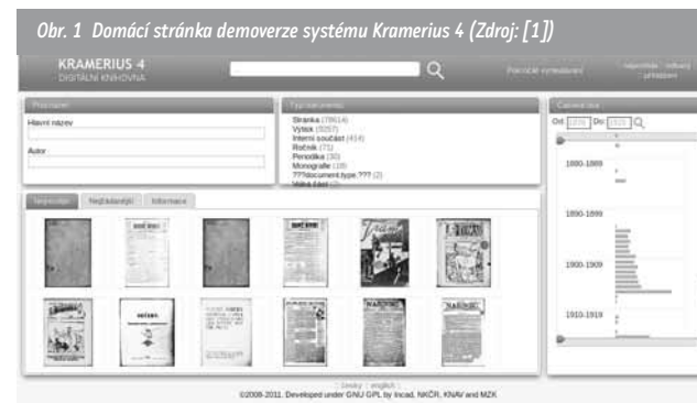
Obr. 1 Domácí stránka demoverze systému Kramerius 4 (Zdroj: [1])

Uživatelské rozhraní si představíme na příkladu testovací implementace systému na serveru Moravské zemské knihovny 1 .