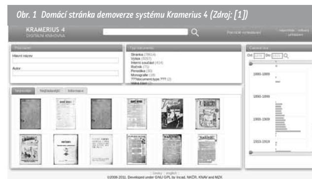
Obr. 1 Domácí stránka demoverze systému Kramerius 4 (Zdroj: [1])

Uživatelské rozhraní si představíme na příkladu testovací implementace systému na serveru Moravské zemské knihovny 1 .