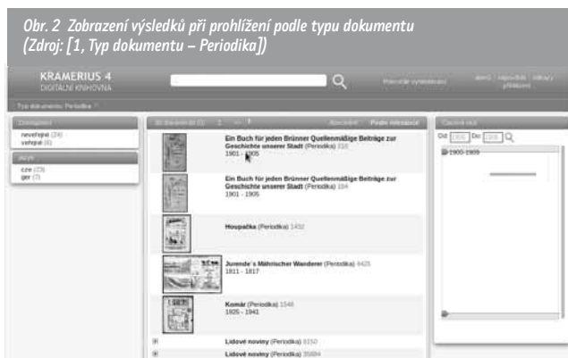
Obr. 2 Zobrazení výsledků při prohlížení podle typu dokumentu

Při zobrazování výsledků vyhledávání nebo při prohlížení může uživatel upřesňovat své požadavky prostřednictvím faset v levé části obrazovky. Například u monografií se jedná o dostupnost, o autory a spoluautory a o jazyk, u periodik pak o dostupnost a o jazyk (obr. 2). Na jednotlivých úrovních dokumentů (napří-