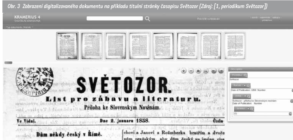
Obr. 3 Zobrazení digitalizovaného dokumentu na příkladu titulní stránky časopisu Světozor

Co se týká zobrazení výsledků vyhledávání či prohlížení, lze si jednotlivé digitalizované stránky (nebo obecně jakékoliv dokumenty vložené do systému) přibližovat a oddalovat