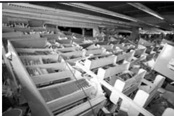
Univerzitní knihovna Christchurch

ODPOVĚĎ: Přestože se s příchodem ekonomické krize výrazně zhoršily podmínky na hledání vhodného místa obecně, myslím, že pokud máte svými znalostmi co nabídnout (výborná angličtina však musí být samozřejmostí), určitě by stálo za to ucházet se o vypsání knihovnicko-informační pozice. Nezapomeňte však, že tak, jako má Evropská unie restrikce na získání pracovního povolení pro přistěhovance, na Novém Zélandu jsou podmínky ještě přísnější. I zde na pracovním trhu platí pravidlo, že zaměstnavatel musí nejdříve hledat vhodného uchazeče mezi těmi, co na Novém Zélandu pobývají, a pokud jej nenalezne, šanci na pozici dostanou i ti, kteří pracovní povolení zatím nemají a nacházejí se třeba i mimo zdejší ostrovy. Pokud se vám podaří dostat do užšího výběru kandidátů a dokážete nabídnout více než ti ostatní, je velice pravděpodobné, že dotyčná instituce (a především pokud se jedná třeba o univerzitní knihovny nebo větší veřejné knihovny) pro vás může pracovní povolení získat. Je zde obvyklé, že pohovory se s vybranými uchazeči často uskutečňují na dálku – telefonicky a zaměstnavatel je často ochotný zaplatit relokační náklady svého nového zaměstnance.