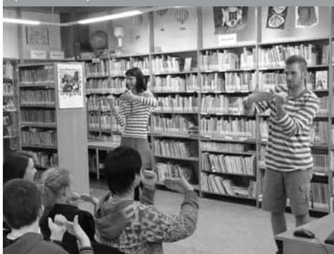
Představení neslyšících studentů DIFA JAMU z Brna pro 7. a 8. třídy ZŠ „Domluvíme se beze slov?“

čních vydavatelství. Dále půjčujeme knihy v Braillově písmu a filmy pro nevidomé, hybridní knihy, knihy se zkrácenými texty pro neslyšící a děti s poruchami čtení, také časopisy, které jsou vydávány cíleně pro skupiny různě zdravotně postižených nebo odborníky.