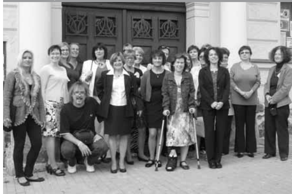
Realizační tým oslav

tří pater schodiště čekalo drobné občerstvení. Provázávali všichni knihovníci a knihovnice.