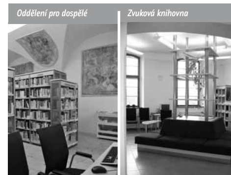
Oddělení pro dospělé

Městská knihovna Jihlava působí v krajském městě s téměř 50 000 obyvateli. V uplynulých letech se postupně transformovala do podoby moderní informační a vzdělávací instituce, která nabízí svým uživatelům bohaté knihovní fondy, pestré spektrum služeb a vhodné podmínky pro organizaci různých komunitních aktivit.