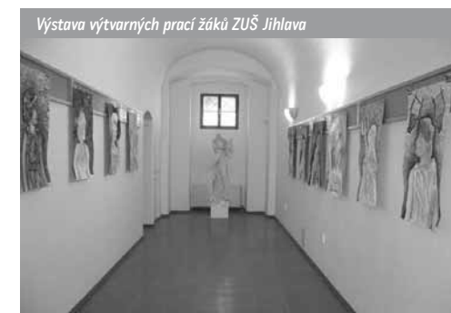
Výstava výtvarných prací žáků ZUŠ Jihlava

Knihovna je pověřena výkonem regionálních funkcí na území okresu Jihlava a soubor těchto služeb pravidelně využívá 98 neprofesionálních knihoven. Od roku 2002, kdy mohla být tato činnost po nucené osmileté přestávce díky státní dotaci obnovena, je v celém regionu patrný jednoznačně pozitivní vývoj. Došlo k řadě změn v umístění a vybavení knihoven, v rozvoji jejich činnosti a nabídce služeb, kvalitě knihovních fondů a v komunikaci prostřednictvím moderních informačních technologií.