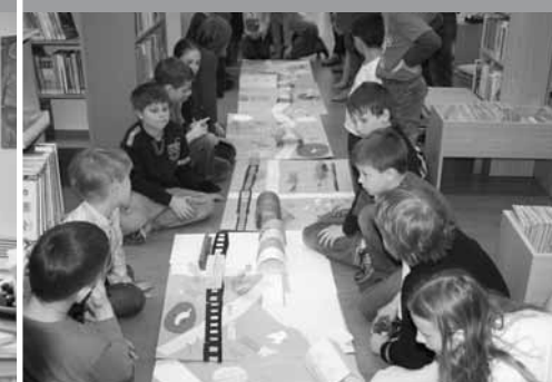
Výtvarná dílna Baobabu v Krajské knihovně