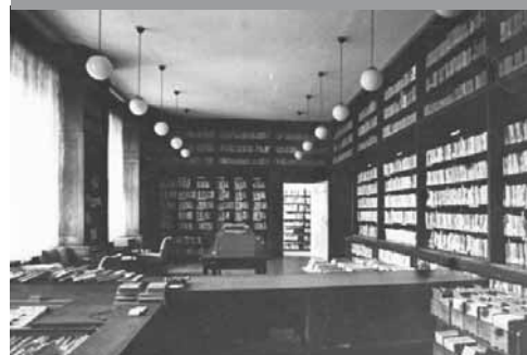
Centrální pult ve vestibulu knihovny – přelom 50. let