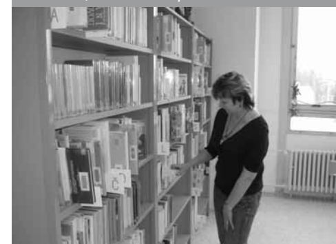
Inventarizace, revize knihovního fondu

Pro knihovny, které se rozhodnou pro přechod na RFID technologii, mohou být kromě předvedení jednotlivých zařízení v provozu zajímavé i zkušenosti z přípravy a realizace projektu. Např. důležitost zahrnutí implementace RFID zařízení do používaného knihovního systému již v požadavcích výběrového řízení, praktické dovednosti, tipy (ale také chyby) spojené s lepením etiket do dokumentů a konverzí fondu. Specifickou zkušeností, prověřenou právě až v podmínkách menší knihovny, je řešení prostorového uspořádání RFID zařízení (bezpečnostní brány, selfcheck). Bylo třeba zajistit bezproblémový a logický pohyb lidí po knihovně a umožnit vizuální kontrolu ze strany knihovníků vzhledem k umístění vstupních dveří a výpůjčního pultu a zároveň dodržet bezpečné vzdálenosti (mezi dveřmi a branami, mezi branami, selfcheckem a PC pro uživatele, aby nedošlo k vzájemnému rušení zařízení a byly splněny hygienické normy pro pohyb v elektromag-