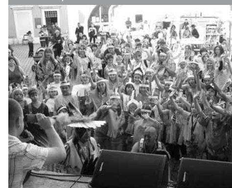
Multikulturní festival – MK Sokolov

dali jsme společně několik dvojjazyčných sborníků povídek sokolovských a schwandorfských autorů, které byly přeloženy vždy do opačného jazyka.