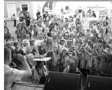
Multikulturní festival – MK Sokolov

dali jsme společně několik dvojjazyčných sborníků povídek sokolovských a schwandorfských autorů, které byly přeloženy vždy do opačného jazyka.