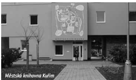
Městská knihovna Kuřim