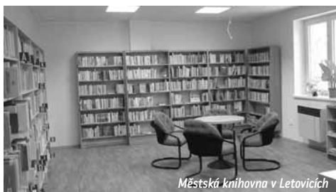
Městská knihovna v Letovicích

Zřejmě nejúspěšnější byl sever okresu – obce územní samosprávy měst Tišnov, Kuřim a Rosice.