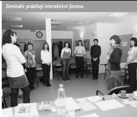
Semináře probíhají interaktivní formou