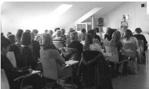
O semináře Centra je stále zájem

Druhý den byl věnován ukázkám besed a pořadů jednotlivých knihoven. Vyšlo najevo, že v knihovnách se dělají většinou souhrnné pořady o dobrodružné literatuře našich sousedů, jednotliví autoři jsou zastoupeni méně. Nejdělečným spisovatelem je pak zřejmě Karel May, který se v programu objevil hned dvakrát. Mluvil se i o rakouském spisovatelé Thomasi Brezinovi, který díky několika stovkám vydaných knížek patří mezi neplodnější dětské spisovatele vůbec.