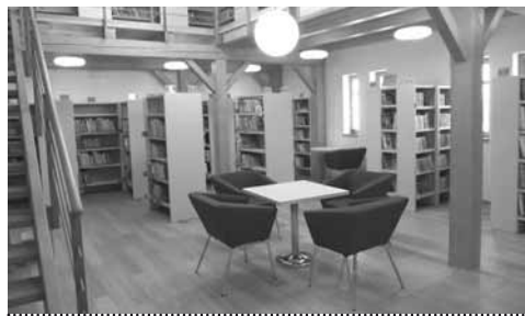
Oddělení pro děti

Autor projektu Ing. arch. Lubomír Dehner pojal přestavbu velkoryse – ke stávajícímu domku, ve kterém se nacházela kancelář a v patře půjčovna, připojil i stodolu, do té doby sloužící jako technické zázemí pro Obecní úřad v Holasovicích. Propojením obou budov vznikl nádherný členitý prostor, který beze zbytku naplnil naše knihovnická očekávání.