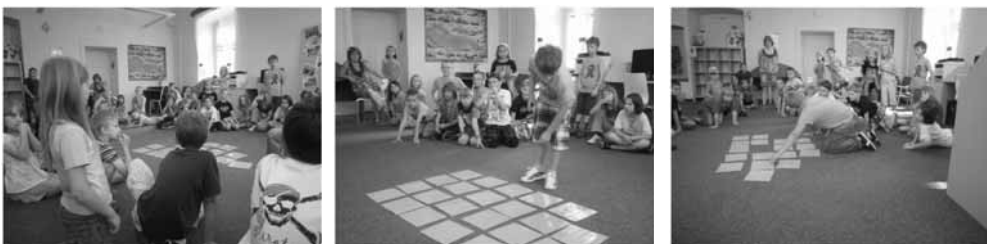
V Městské knihovně ve Slaném již lekce IV připravují, proč ale nebyť ještě lepší...