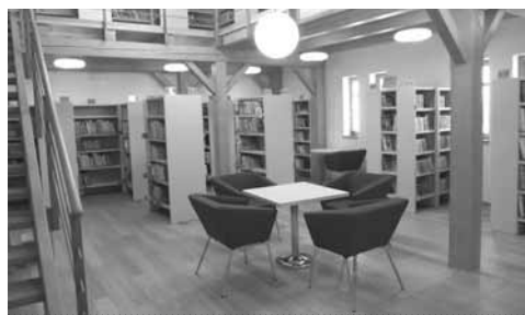
Oddělení pro děti