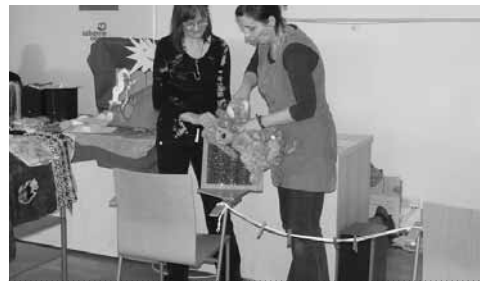
Semináře doprovázejí praktické ukázky

s dětmi o čtení a představovala jim zajímavé knihy. Díky tomu nejde o jednorázovou akci, ale o systematickou podporu čtenářství – a knížkám tak „unikne“ jen málokterý ze začínajících čtenářů. Oproti předchozím ročníkům nastala letos malá změna, která způsobila při psaní zpráv a hodnocení velké gramatické problémy se změnou „y“ a „i“ – ke královně knížek přibyl totiž i král. V průběhu června se prvňáčci účastnili slavnostního programu nazvaného Klíčování , kde obdrželi klíč od království knížek a další drobné odměny.