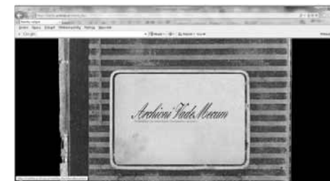
Databáze Archivní VadeMecum