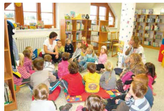
▲ Mateřská škola v knihovně Knihovna jako „obývák města“ ▶