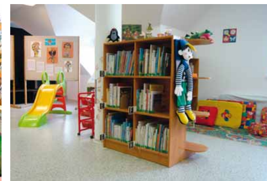
◀ Knihovnická stonožka