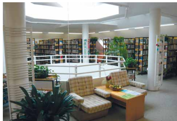
▲ Oddělení pro dospělé