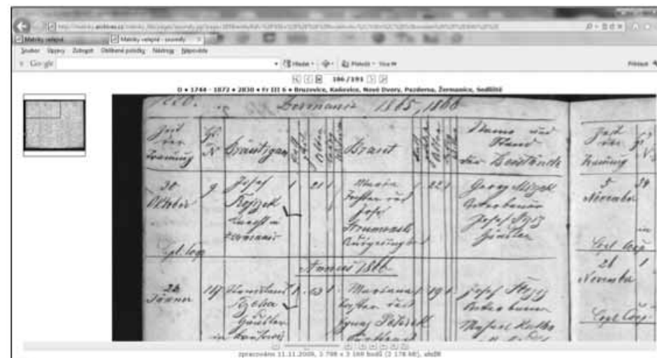
Náhled do knihy sňatků – záznamy z roku 1865