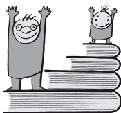
ROSTEME S KNIHOU

Občanské sdružení Svaz českých knihkupců a nakladatelů a jeho společnost Svět knihy, s. r. o., zahájily v roce 2005 propagační kampaň na podporu čtení knih v České republice s názvem Rosteme s knihou . Byla reakcí na alarmující výsledky výzkumů čtenářské vyspělosti v tuzemsku i zahraničí, které dokazují výrazný pokles zájmu mládeže o četbu a knihy. Kampaň je tedy především zaměřená na získávání kladného vztahu k literatuře a knihám, snaží se novým a zajímavým způsobem oslovovat zejména předškolní a školní mládež, rozvíjet a prohlubovat její literární vzdělání, zlepšovat a obohacovat komunikační schopnosti a obecně kulturní znalosti mladých lidí. Do své činnosti zapojuje rodiče a pedagogy a také partnery kampaně, kterých je v současné době již sedmadvacet – nakladatele, knihovníky a instituce se vztahem k podpoře dětského čtenářství. Má ambice být průvodcem knižním světem a upozorňovat na prospěšné aktivity mnoha různých subjektů v České republice.