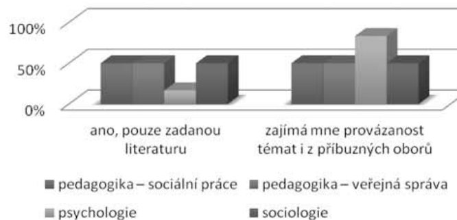
Graf 1: Preferujete čtení odborné literatury jen ze svého studijního oboru?

Další oblastí výzkumného zájmu se stal výběr typu média jako nástroje při vyhledávání důležitých informací v rámci oboru. Studenti se téměř shodně vyslovili jak pro knihy, tak pro