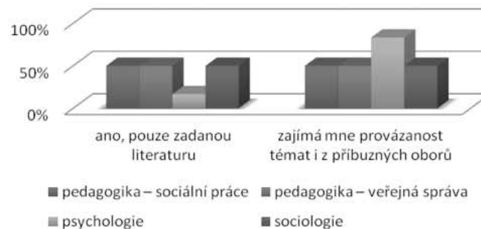
Graf 1: Preferujete čtení odborné literatury jen ze svého studijního oboru?

Další oblastí výzkumného zájmu se stal výběr typu média jako nástroje při vyhledávání důležitých informací v rámci oboru. Studenti se téměř shodně vyslovili jak pro knihy, tak pro