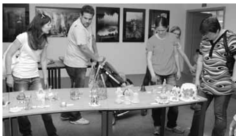
Výstava zvonků 2011

herna, kde se konají pestré odpolední aktivity pro mládež. V Litvínově totiž chybí centrum volného času pro děti a knihovna má ambici tuto službu částečně nahradit. Novinkou v herně je moderní technika, jako je hrací konzole, projektor, taneční podložka či wi-fi zóny. Zpracovávají se také čtyři noví pracovníci , kteří se dětem maximálně věnují.