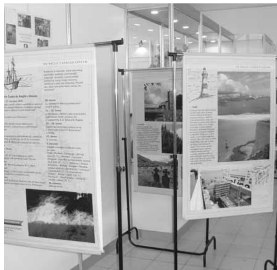
Výstava Do Anglie s Karlem Čapkem

Výstava Život a doba spisovatele Karla Čapka putuje po knihovnách již od roku 2009 a podle zájmu ještě minimálně letošní rok putovat bude. Výstava Do Anglie s Karlem Čapkem byla vytvo-