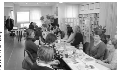
Podzemní setkání knihovníků v Březnici (2011)

Do dnešního dne se uskutečnila tři neformální setkání knihovníků . Po dohodě s Městskou knihovnou v Kralupech nad Vltavou, se Vzornou lidovou knihovnou Velké Popovice a Městskou knihovnou