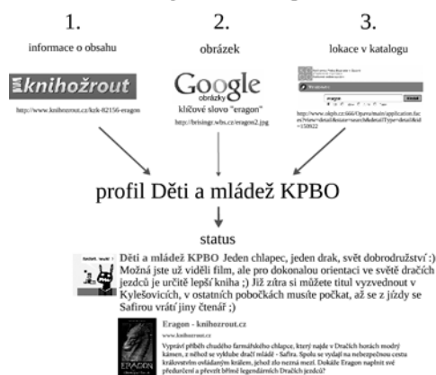
Obr. 2: Příklad příspěvku získaného harvestingem z různých informačních zdrojů

Na základě těchto informací pak lze udělat jednorázovou, v případě potřeby ale i vícenásobnou rešerši, vybrat a nashromáždit informační zdroje odpovídající zjištěným charakteristikám a ty pak sledovat, pravidelně kontrolovat a sbírat či vybírat