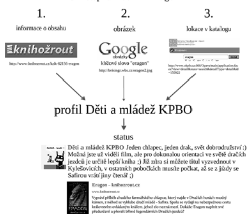
Obr. 2: Příklad příspěvku získaného harvestingem z různých informačních zdrojů

Na základě těchto informací pak lze udělat jednorázovou, v případě potřeby ale i vícenásobnou rešerši, vybrat a nashromáždit informační zdroje odpovídající zjištěným charakteristikám a ty pak sledovat, pravidelně kontrolovat a sbírat či vybírat