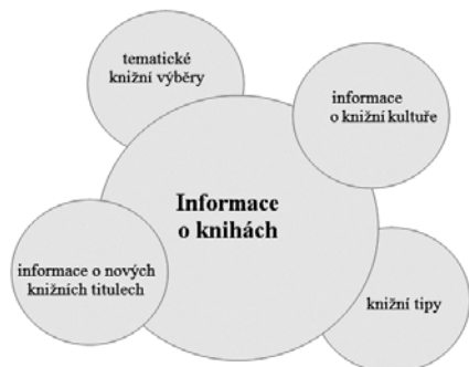
Obr. 4: Schéma struktury modulu Informace o knihách

Obsahové údaje pro modul Informace o knihách mohou být získávány v podstatě dvojím způsobem. V prvním případě je to samostatná iniciativa a snaha pracovníka knihovny jako správce profilu. To znamená např.: