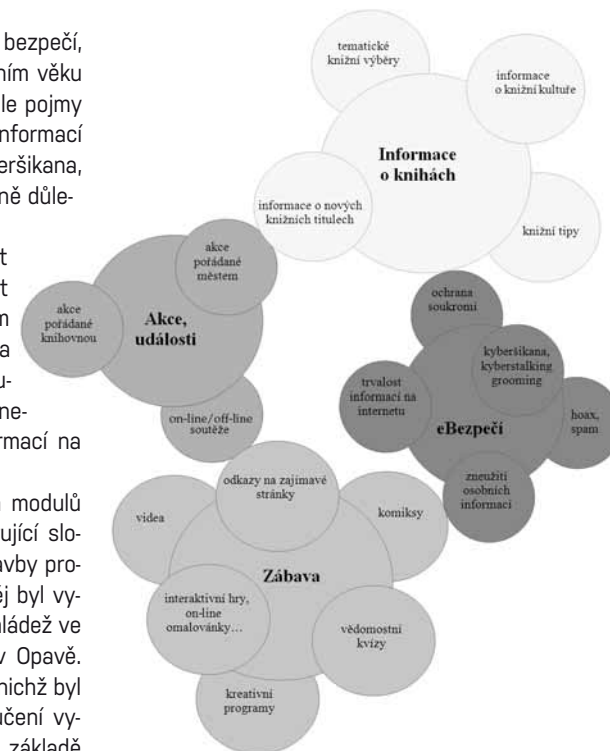
Obr. 8: Schéma podrobnější tematické struktury modelu profilu Děti a mládež KPBO