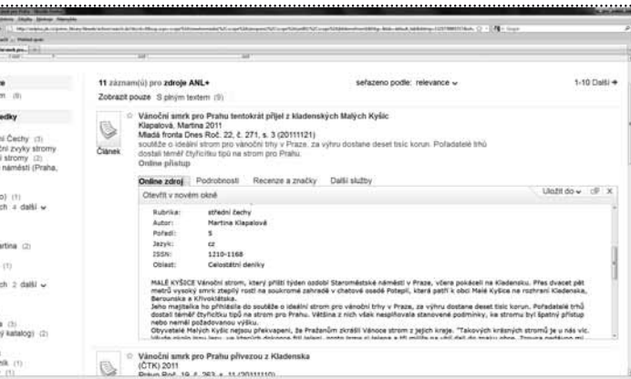
↑ Obr. 1: Zdroje 1 a 2 – porovnání metadat ↓ Obr. 2: Zdroj 2 – plný text

Možnost prohledávání plných textů soustředěných v centrálním indexu, který obsahuje kromě článků i přepis televizního a rozhlasového zpravodajství a možnost okamžitého získání přepisu plného textu (viz obr. 2) a zobrazení náhledu na digitalizovanou podobu původního článku, pokud chceme vidět i obrázky (viz obr. 3), již posouvá zájček vah jasně směrem ke zdroji 2.