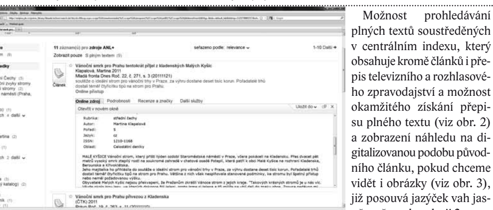
↑ Obr. 1: Zdroje 1 a 2 – porovnání metadat ↓ Obr. 2: Zdroj 2 – plný text

Možnost prohledávání plných textů soustředěných v centrálním indexu, který obsahuje kromě článků i přepis televizního a rozhlasového zpravodajství a možnost okamžitého získání přepisu plného textu (viz obr. 2) a zobrazení náhledu na digitalizovanou podobu původního článku, pokud chceme vidět i obrázky (viz obr. 3), již posouvá zájček vah jasně směrem ke zdroji 2.