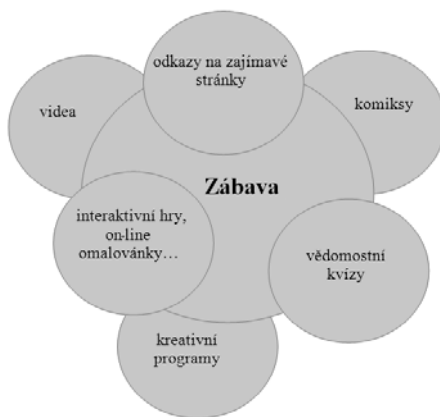
Obr. 5: Schéma struktury modulu Zábava

Způsob naplňování profilu a charakter obsahu tohoto modulu je do značné míry závislý na konkrétní osobě, která jej bude vykonávat. Je vhodné nebát se identifikovat, akceptovat a přizpůsobit nárokům, zájmům a požadavkům vykazovaných cílovou skupinou.