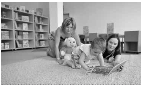
„Dětský ráj“ pro nejmenší čtenáře, oddělení pro děti a mládež Regionální knihovny Karviná

Regionální knihovna Karviná (dále jen RKK) usilovala o vybudování své ústřední knihovny bezmála 45 let. Díky podpoře našeho statutárního města byl záměr rekonstrukce knihovny zařazen do Integrovaného plánu rozvoje měst a byla podána žádost o dotaci z Regionálního operačního programu Moravskoslezského kraje v Ostravě. Smyslem projektu bylo vytvořit moderní městský vzdělávací, informační, komunitní a kreativní komplex s kvalitními službami a uživatelským komfortem.