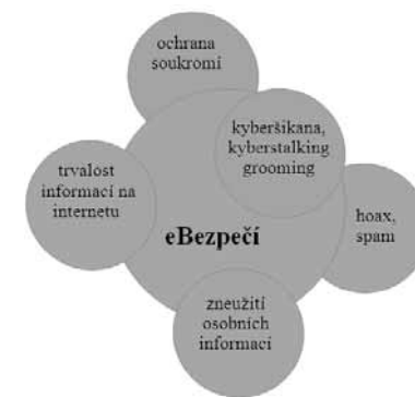
Obr. 7: Schéma struktury modulu eBezpečí

Na prezentaci výsledků tohoto hodnocení již v článku není místo, jsou však obsaženy v diplomové práci, jež se tímto průzkumem zabývala a je též zdrojovým dokumentem. Plný text je k dispozici i na internetu po zadání názvu práce do vyhledávače.