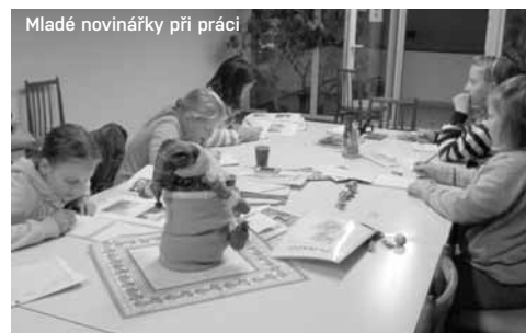
Mladé novinářky při práci

A co se nám za loňský rok povedlo? Jak děti kroužek vnímají a co jim přináší? Jako správní novináři vám o tom sami napsali několik odstřehů.