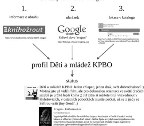
Obr. 2: Příklad příspěvku získaného harvestingem z různých informačních zdrojů

Na základě těchto informací pak lze udělat jednorázovou, v případě potřeby ale i vícenásobnou rešerši, vybrat a nashromáždit informační zdroje odpovídající zjištěným charakteristikám a ty pak sledovat, pravidelně kontrolovat a sbírat či vybírat