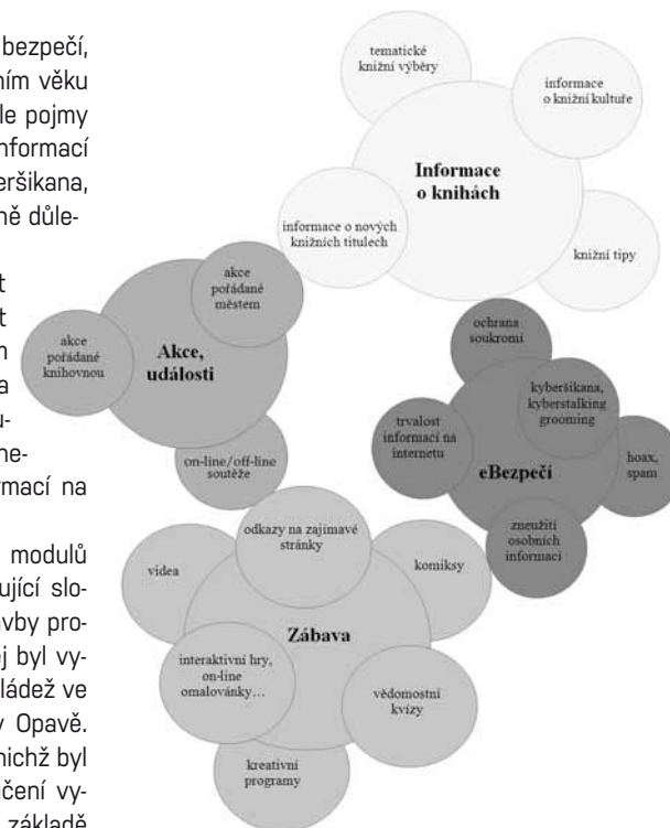
Obr. 8: Schéma podrobnější tematické struktury modelu profilu Děti a mládež KPBO