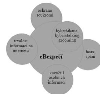
Obr. 7: Schéma struktury modulu eBezpečí

Na prezentaci výsledků tohoto hodnocení již v článku není místo, jsou však obsaženy v diplomové práci, jež se tímto průzkumem zabývala a je též zdrojovým dokumentem. Plný text je k dispozici i na internetu po zadání názvu práce do vyhledávače.