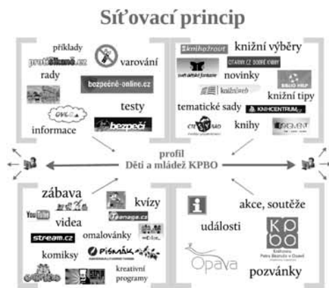
Obr. 1: Síťovací princip testovacího profilu Děti a mládež KPBO na FB

Obrázek 1 názorně ilustruje síťovací princip přímo na profilu Děti a mládež KPBO, který je předmětem praktické části této studie.