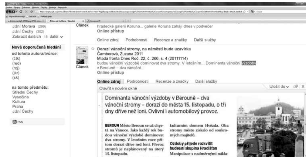
Obr. 3: Zdroj 2 – náhled na digitalizovanou podobu původního článku

Pokud porovnáme pouze metadata pocházející ze zdrojů 1 a 2 (viz obr. 1, nahoře zdroj 2, dole zdroj 1), nevychází porovnání pro zdroj 2 příliš lichotivě.