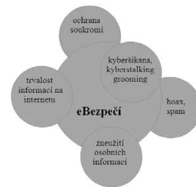
Obr. 7: Schéma struktury modulu eBezpečí

Na prezentaci výsledků tohoto hodnocení již v článku není místo, jsou však obsaženy v diplomové práci, jež se tímto průzkumem zabývala a je též zdrojovým dokumentem. Plný text je k dispozici i na internetu po zadání názvu práce do vyhledávače.