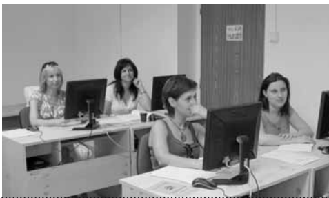
Kurz knihovnického minima (Kladno, květen 2011)

Díky nové koncepci mohlo krajské metodické oddělení Středočeské vědecké knihovny v Kladně nabízet od roku 2006 mnohem více vzdělávacích akcí než předtím. Také stále častější požadavky knihovníků na pořádání přednášek o české literatuře nás přiměly k zorganizování cyklu přednášek pod společným názvem Současné české literární dění , které byly již od počátku určené především pracovníkům knihoven ve službách a akvizitérům. Součástí cyklu byly tyto přednášky: Prolegomena k nejmladší poezii, Současná česká próza, Kritika a esejistika, Literární brak, Drama a literatura v médiích, Česká poezie a Nakladatelství a edice . Takový cyklus by se mohl periodicky opakovat po třech letech doplněný o nové poznatky.