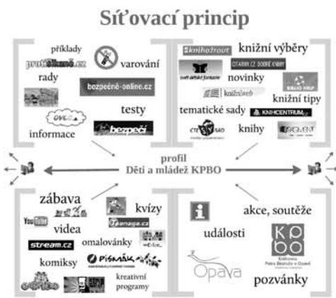
Obr. 1: Síťovací princip testovacího profilu Děti a mládež KPBO na FB

Obrázek 1 názorně ilustruje síťovací princip přímo na profilu Děti a mládež KPBO, který je předmětem praktické části této studie.