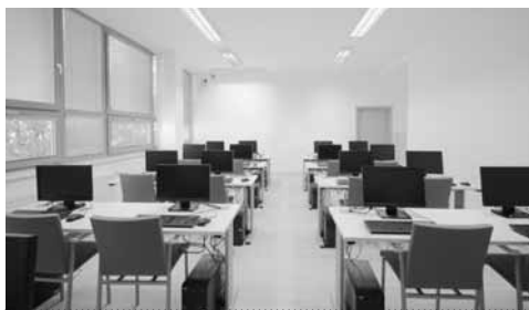
Multimediální učebna svým informačně technologickým vybavením poskytuje zázemí pro pořádání seminářů, lekcí počítačové gramotnosti, knihovnické lekce a další vzdělávací kurzy

Ve všech půjčovnách na třech podlažích se nacházejí bezpečnostní brány, které chrání knihovní fond před zcizením, neboť každý titul je označen RFID čipy pro jeho identifikaci a bezpečnost. Knihovna disponuje třemi samoobslužnými stanicemi BiblioSelfCheck. Všechny tyto zmíněné komponenty dodala firma Cosmotron Bohemia, s. r. o., Hodonín.