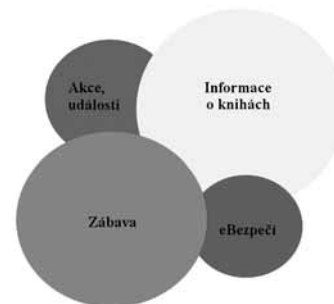
Obr. 3: Schéma struktury tematické náplně vzorového profilu Děti a mládež KPBO

Způsob naplňování profilu byl již osvětlen, jedna ze dvou směrodatných otázek – „Jak?“ – byla zodpovězena. Zbývá ještě najít odpověď na druhou otázku – „Co?“ – aneb struktura a složení vlastní náplně vzorového profilu. Po důkladném zamyšlení nad možnostmi a mezemi, kterými se OASS Facebook vyznačuje, byly stanoveny čtyři okruhy sdružující základní témata, o nichž lze z pohledu knihovny uvažovat jako o adekvátních. Tematickou strukturu hlavních okruhů ilustruje obrázek 3.