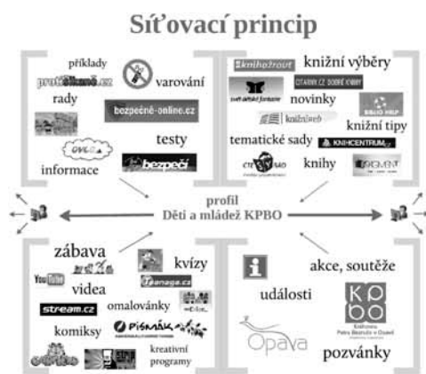
Obr. 1: Síťovací princip testovacího profilu Děti a mládež KPBO na FB

Obrázek 1 názorně ilustruje síťovací princip přímo na profilu Děti a mládež KPBO, který je předmětem praktické části této studie.