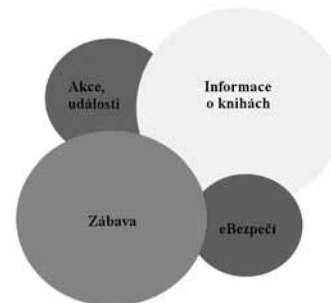
Obr. 3: Schéma struktury tematické náplně vzorového profilu Děti a mládež KPBO

Způsob naplňování profilu byl již osvětlen, jedna ze dvou směrodatných otázek – „Jak?“ – byla zodpovězena. Zbývá ještě najít odpověď na druhou otázku – „Co?“ – aneb struktura a složení vlastní náplně vzorového profilu. Po důkladném zamyšlení nad možnostmi a mezemi, kterými se OASS Facebook vyznačuje, byly stanoveny čtyři okruhy sdružující základní témata, o nichž lze z pohledu knihovny uvažovat jako o adekvátních. Tematickou strukturu hlavních okruhů ilustruje obrázek 3.