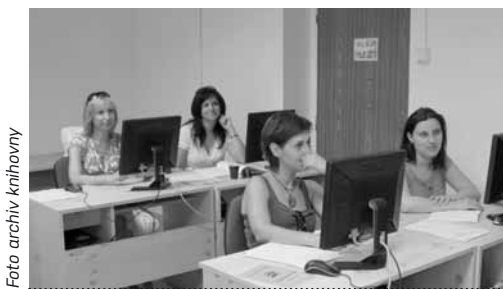
Kurz knihovnického minima (Kladno, květen 2011)

Díky nové koncepci mohlo krajské metodické oddělení Středočeské vědecké knihovny v Kladně nabízet od roku 2006 mnohem více vzdělávacích akcí než předtím. Také stále častější požadavky knihovníků na pořádání přednášek o české literatuře nás přiměly k zorganizování cyklu přednášek pod společným názvem Současné české literární dění , které byly již od počátku určené především pracovníkům knihoven ve službách a akvizitérům. Součástí cyklu byly tyto přednášky: Prolegomena k nejmladší poezii, Současná česká próza, Kritika a esejistika, Literární brak, Drama a literatura v médiích, Česká poezie a Nakladatelství a edice . Takový cyklus by se mohl periodicky opakovat po třech letech doplněný o nové poznatky.