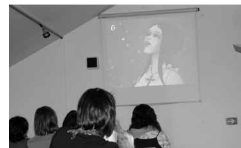
Seminář Literatura pro děti a mládež ve filmu, ukázka z básně Svatební košile

Součástí činnosti Centra je také prezentace aktivit SKIP KDK studentům některých kateder Pedagogické a Filozofické fakulty Masarykovy univerzity. Ti mají také možnost absolvovat v knihovně předmět Práce s dětským čtenářem , v rámci kterého připravují a realizují besedu s žáky. Mají tak příležitost seznámit se blíže s nabídkou knihovny a jejím prostředím. Díky zpětným vazbám, které jim pracovníci Centra i samotní pedagogové zvolených škol poskytují, si sami uvědomují, jak jim knihovny mohou být nápomocné v jejich pedagogické praxi.