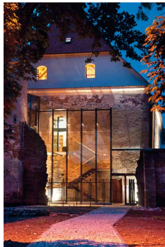
Knihovnické a informační centrum FM VŠE v Jindřichově Hradci