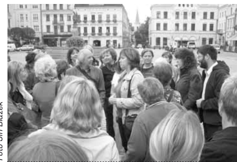
Účastníci odborné exkurze do historických knihoven v Těšíně (Polsko)