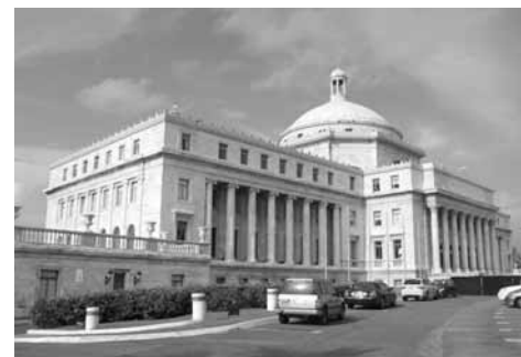
Kapitol – sídlo parlamentu

niční politikou. Většina Portorikánců je, zdá se, s tímto stavem spokojena, protože zastánci samostatnosti v občas konaných referendech svoji věc opakovaně prohrávají. V rozhovorech vystavují na odív a jsou hrdí, jak říkají, na svou indiánsko-afričskou duši, španělského ducha a americké tělo. Zkrátka netají se tím, že v současnosti převažují výhody (zejména ekonomické) jejich spojení s USA nad nevýhodami (například účast v armádě) z toho plynoucími. Řekněte například, komu z nás by se také nelíbilo tankovat 95 oktanový benzin 1 galon (necelé čtyři litry) za pouhých 96 centů (necelých 19 Kč)? Tento vliv USA se samozřejmě také odráží ve vyspělé organizaci, vybavení a funkcionalitě portorického knihovnictví, které je na světové úrovni.