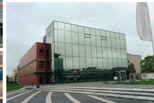
Akademická knihovna Jihočeské univerzity v Českých Budějovicích