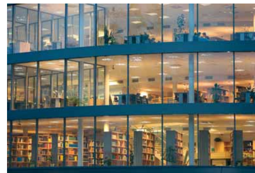
Knihovnické a informační centrum FM VŠE v Jindřichově Hradci