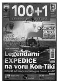
Obr.1: Nejaktuálnější obálka tohoto souborného záznamu detail