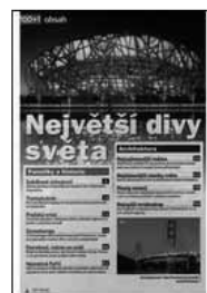
Obr.4: Vlastní obsah tohoto souborného záznamu