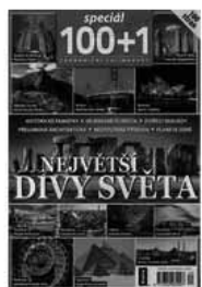
Obr.2: Vlastní obálka tohoto souborného záznamu

Rok: 2015 ISBN: 9770322962003 NKP-CNB: cnb000357052