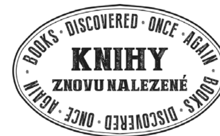
Logo projektu Knihy znovu nalezené

V dnešní době je důležitou součástí propagace její vizuální stránka. Proto jsme již na prvním setkání s norským partnerem diskutovali o vizuální značce projektu. Postupem času jsme přišli s návrhem loga v designu razítka. Při