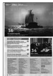
Obr.3: Nejaktuálnější obsah tohoto souborného záznamu detail