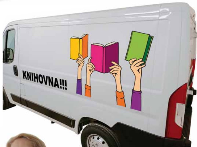
Polep knihovnické dodávky