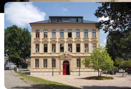
↑ Rekonstruovaná budova bývalé školy, dnes Knihovna Kutná Hora