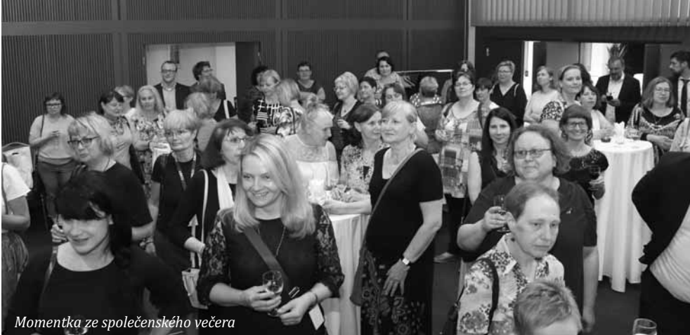
Momentka ze společenského večera