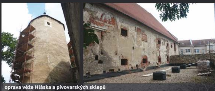
oprava věže Hláška a pivovarských sklepů