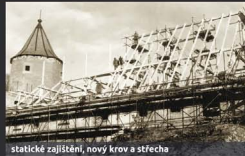
statické zajištění, nový krov a střecha