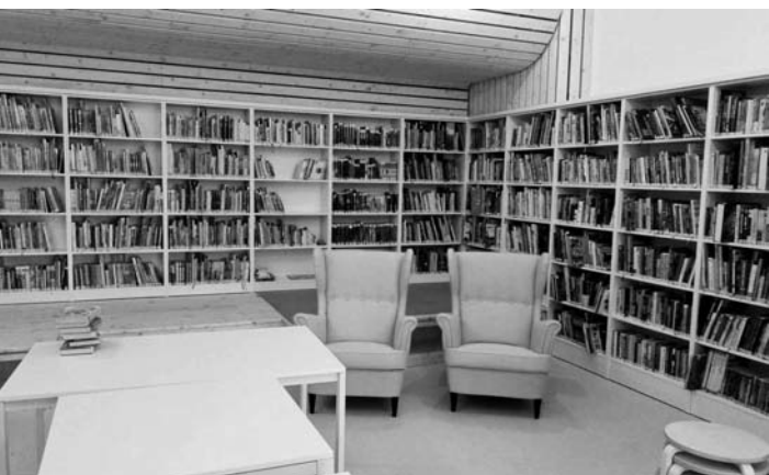
Inspirovající interiér pobočky Městské knihovny Tábor v Sídlišti nad Lužnicí