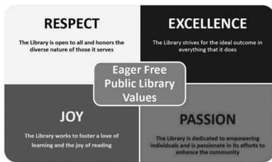
Příklad vizualizace hodnot v Eager Free Public Library

Řada výzkumů potvrzuje, že veřejné knihovny v dnešní době přesahují svoji původní roli. Proto je důležité definovat si základní pojetí významu knihovny esenciální otázkou: Co je to knihovna? (Harland, Stewart, Bruce, 2012). Při samotné definici hodnot si můžeme klást otázky typu: Jaké následky by mělo náhlé přerušení fungování našich služeb, popř. v kterých činnostech je knihovna nezastupitelná? Můžeme si zkusit odpovědět i na to, kolik času či financí poskytováním svých služeb ušetříme jednomu uživateli, popř. celé komunitě (Oakleaf, 2010).