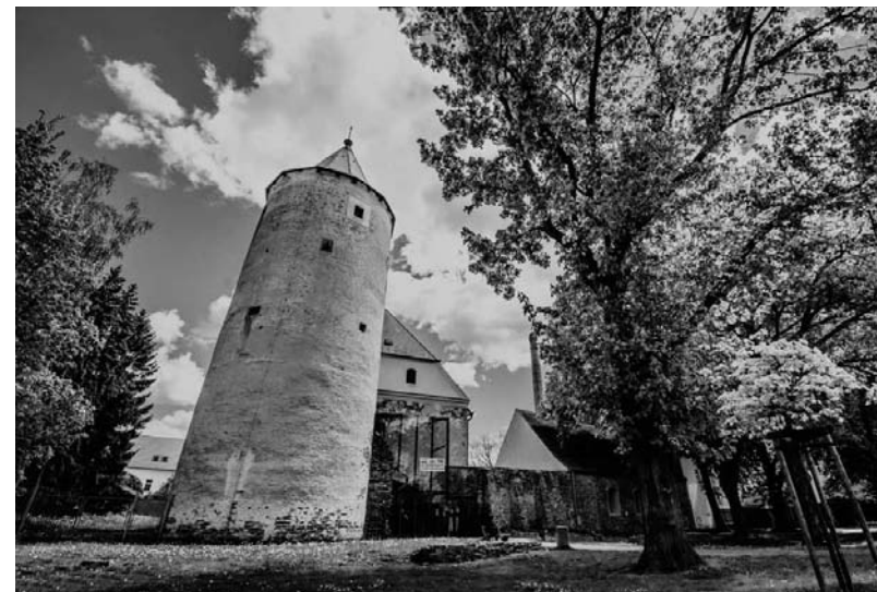
Vstup do knihovny a jeho dominantu věž Hláska při pohledu z parku

Od roku 2002 se prováděly na hradu práce s použitím finančních prostředků z Programu regenerace městských památkových zón a následně z Programu záchrany architektonického dědictví. K rozsáhlé finančně a technicky náročné obnově hradního paláce došlo v plném rozsahu především díky podpoře z Evropského regionálního rozvojového fondu. V roce 2008 bylo město úspěšné v získání finanční dotace ve výši 36,2 mil. korun z Regionálního operačního programu NUTS II Jihozápad, a tak se přikročilo k vestavbě knihovny. Celkové náklady projektu, který se realizoval v letech 2009–2010, dosáhly téměř 45 mil. korun.