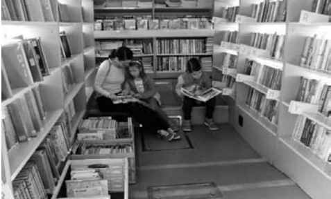
Interiér knihovny na kolech