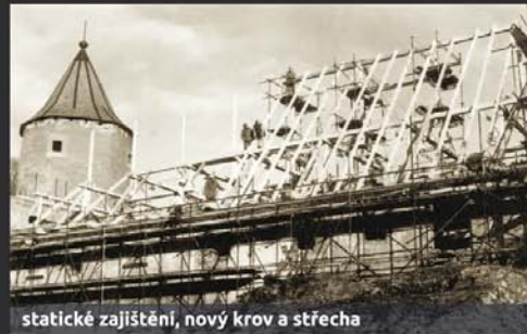
statické zajištění, nový krov a střecha