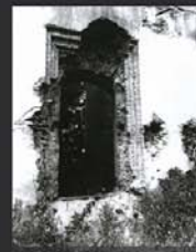
torzo hradního paláce před rekonstrukcí