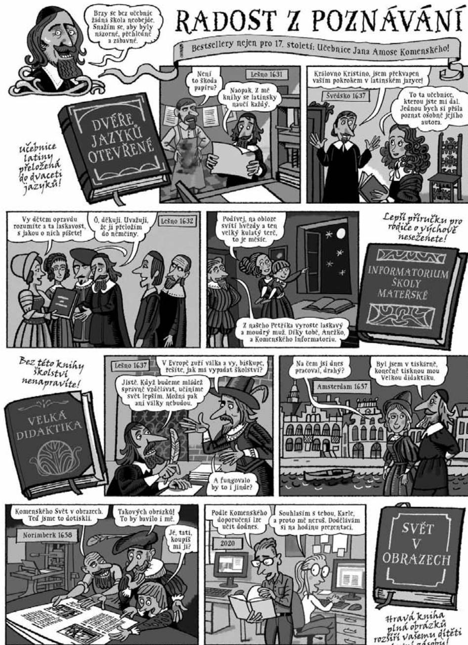
Panel z výstavy Komenský v komiksu na téma Radost z poznávání , text Klára Smolíková, kresby Lukáš Fibrich

Stále platný je jistě apel, že učení musí povzbuzovat spontánnost a jedinečnost jednot-