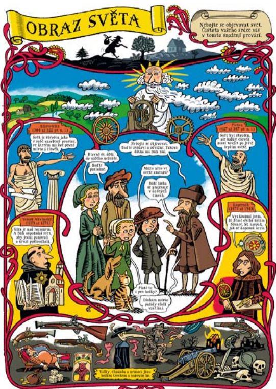
↑ Panel z výstavy Komenský v komiksu na téma Obraz světa Obr.: text Klára Smolíková, kresby Lukáš Fibrich