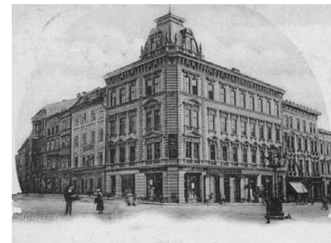
Budova Ústřední rolnické záložny v roce 1900