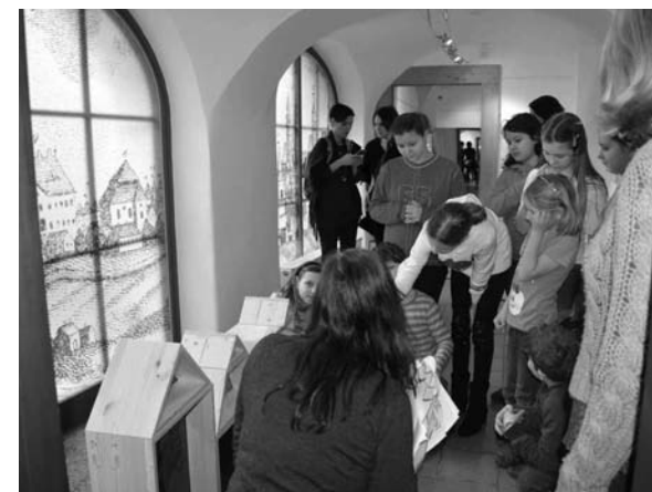
Momentka z doprovodného programu na výstavě s lektorem

Hned první otázkou, která se při přemítání nad Komenským vynoří, je, proč vzdělanec sedmnáctého století vlastně ztrácel úvahami nad školami čas. Dokonce neváhal sepsat pojednání o výchově předškolních dětí, které nazval Informatorium školy mateřské . Přípravoval se přece na duchovní dráhu. Proč se tedy nevěnoval prestižnějším úkolům?