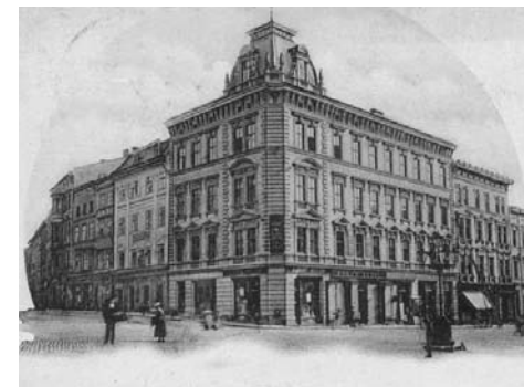
Budova Ústřední rolnické záložny v roce 1900