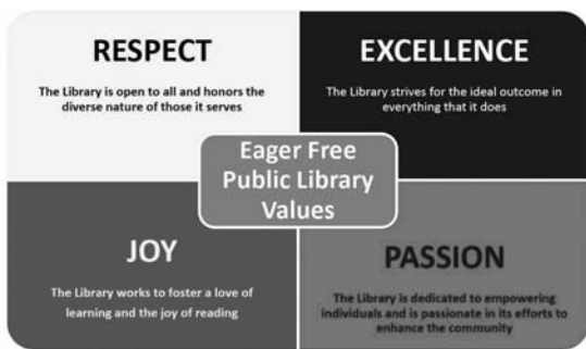
Příklad vizualizace hodnot v Eager Free Public Library

Řada výzkumů potvrzuje, že veřejné knihovny v dnešní době přesahují svoji původní roli. Proto je důležité definovat si základní pojetí významu knihovny esenciální otázkou: Co je to knihovna? (Harland, Stewart, Bruce, 2012). Při samotné definici hodnot si můžeme klást otázky typu: Jaké následky by mělo náhlé přerušení fungování našich služeb, popř. v kterých činnostech je knihovna nezastupitelná? Můžeme si zkoušet odpovědět i na to, kolik času či financí poskytováním svých služeb ušetříme jednomu uživateli, popř. celé komunitě (Oakleaf, 2010).