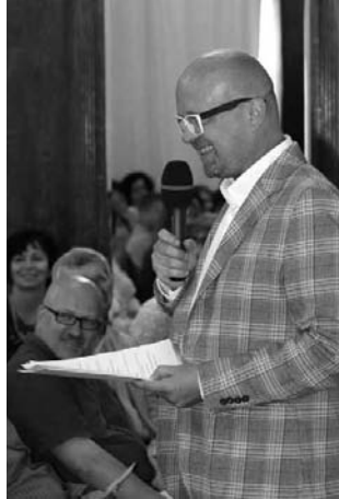
Zahájení valné hromady SKIP 2019 v Obecním domě v Praze

zájmy knihoven a knihovníků na všech úrovních a podporuje vzájemnou spolupráci a sdílení výsledků dobré praxe. Velmi důležitá je spolupráce s Ministerstvem kultury, s Ministerstvem školství, mládeže a tělovýchovy, Ministerstvem práce a sociálních věcí, Ministerstvem vnitra, Ministerstvem pro místní rozvoj ve všech oblastech společného zájmu. Dále spolupracujeme s Asociací krajů ČR, Svazem měst a obcí ČR, Sdružením místních samospráv, Národní sítí zdravých měst a dalšími partnery. Rozvíjíme spolupráci se Spolkem pro obnovu venkova ČR a podílíme se na soutěži Vesnice roku. Trvale usilujeme o společný postup a kooperaci s knihovnami i všemi jejich sdruženími: Sdružením knihoven ČR, Asociací knihoven vysokých škol, Knihovnickou komisí Asociace muzeí a galerií (AMG), Českou národní skupinou Mezinárodního sdružení hudebních knihoven, archivů a dokumentačních středisek (IAML), Českou sekci Mezinárodního sdružení pro dětskou knihu (IBBY), sdružením Magnesia Litera aj. Podporujeme rovněž spolupráci s vydavateli, knihkupci, autory a kolektivními správci autorských práv. Participujeme na vyjednávání hromadných smluv na poskytování služeb knihoven v digitálním prostředí.