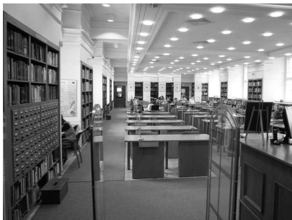
Exteriér a interiér Ossolinea (Národní knihovny Ossolinských) ve Vratislavi