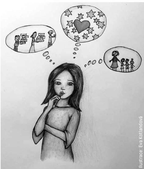
Ilustrace: Eva Kottlandová

Strategii komunikace si můžete vytvořit během jednoho večera v hospodě. Má, pravda, vadu v tom, že není široce prodiskutována lidmi z vaší organizace. Není opřená o solidní hloubkové rozhovory s klienty. Ale je pořád stokrát lepší než žádná strategie.