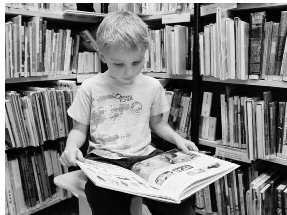
Jeden ze čtenářů oddělení pro děti

Na půdičce naší knihovny. Myšlenka přespat s dětmi u nás v knihovně vznikla po inspirativní přednášce dr. Václava Mertina, kterého jsme pozvali do Uherského Hradiště na seminář pro knihovnice jižní a severní Moravy. Zsvěceně hovořil o dětech, které nerady čtou, o vzorech, které by jim měla dát rodina, o tom, jak je krásné společně vyšetřit chvíličku ke společné četbě... Nápad byl na světě, a aby byl program první noci pestrý, pozvaly jsme také kolegyně z blízkých i vzdálených knihoven, které nás v tom nenechaly samotné. V tuto „první nultou“ pohádkovou noc v roce 2000 odešly od nocujících dětí elektronické pozdravy Mgr. Zlatě Houškové do Národní knihovny, prof. Zdeňku Matějčkoví, dr. Václavu Mertinovi i samotnému H. Ch. Andersenovi. A tak od roku 2000 každé narozeniny slavíme