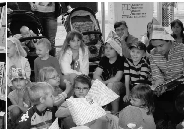
Hradištské sluníčko – čtení večerničky