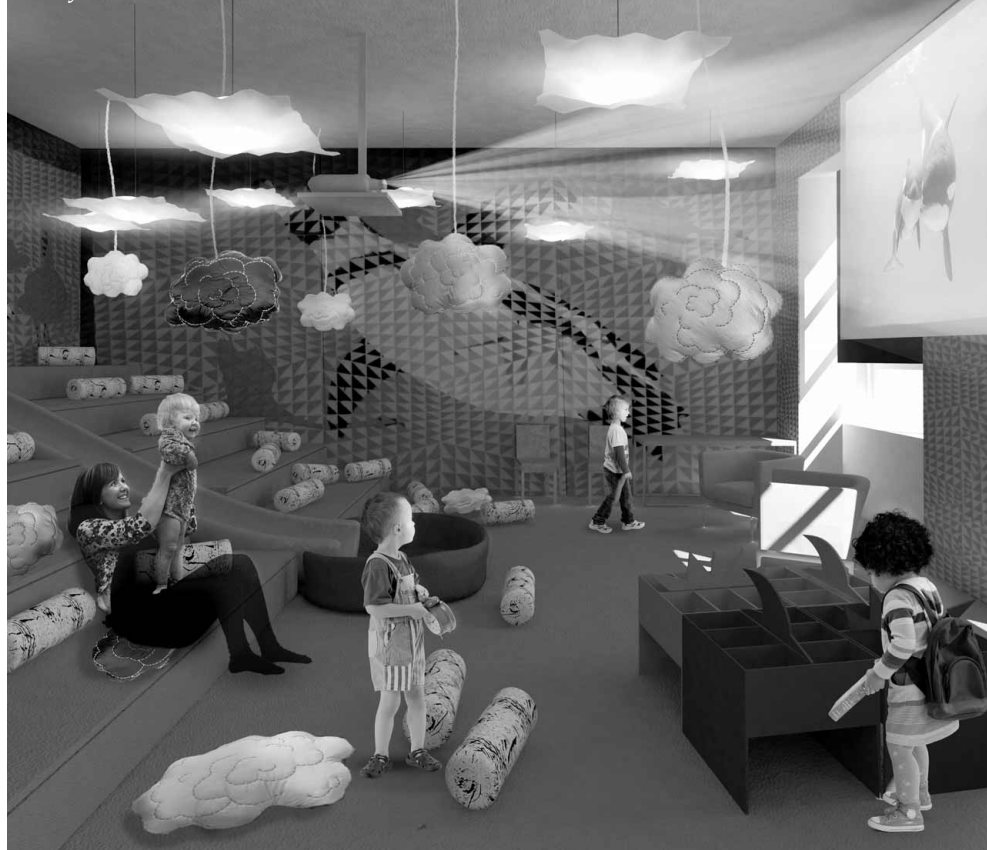
Vizualizace: město Písek