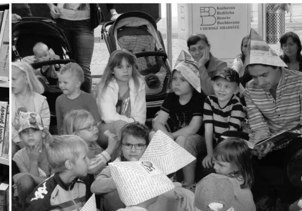
Hradištské sluníčko – čtení večerničky