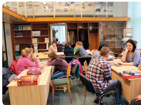
Deskové hry do vědecké knihovny patří! s. 63–64 ← Momentka z průběhu Deskohraní ↓ Studenti zkoušejí hry pro nevidomé