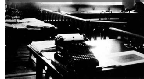
Pohled do úřadovny obecního úřadu v Toužimí, kde byla umístěna i knihovna

Celkové příjmy knihovny činily v roce 1910 192 rakousko-uherských korun (K), z toho 65 K získala knihovna od spolků, společenstev a podobných organizací, a 127 K z poplatků za využívání a ze zápisného (vč. dobrovolných poplatků a pokut). Výdaje činily celkem 203 K, z toho 120 K bylo vydáno na zakoupení knih a na předplatné časo-