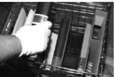
Umístění knih do speciálních košů před vložením do technologie odkyselování Papersave Swiss

V letech 2016–2019 bylo díky finanční podpoře Ministerstva kultury v rámci grantového programu Veřejné informační služby knihoven (VISK) , konkrétně VISK 7, celkem odkyseleno několik tisíc knih. Průměrná hodnota pH povrchu před odkyselením knih se pohybovala okolo 3,5–4 a po odkyselení se dostala na hodnoty okolo 7,5–8, což je hodnota, při které je papír a jeho chemická struktura nejstabilnější. V roce 2019 jsme začali poprvé odkyselovat knihovní fondy ve větším množství díky zvýšené ministerské dotaci ve výši šesti milionů korun.