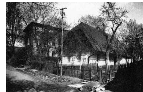
Budova české školy (1875), výuka do roku 1923; německá škola (chaloupka) 1872–1903