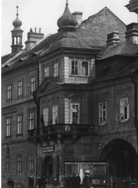
Dům U Špuláků – sídlo Palackého čítárny a později Městské veřejné knihovny v Hradci Králové (1923–1939)

Největší obecní knihovnou v okolí Hradce Králové byla ta na Pražském Předměstí . Její obliba mnohdy převyšovala i hradeckou městskou knihovnu. Z původní spolkové knihovny se v roce 1920 stala knihovna městská (Pražské Před-