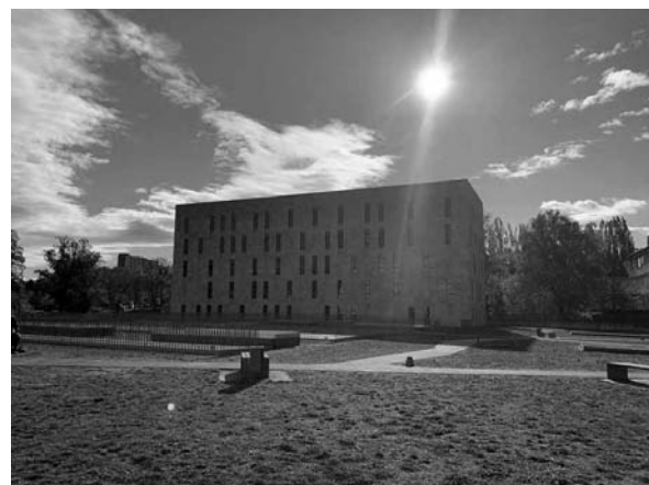
Budova společné knihovny pro Saskou zemskou knihovnu a Technickou univerzitu Drážďany z roku 2002