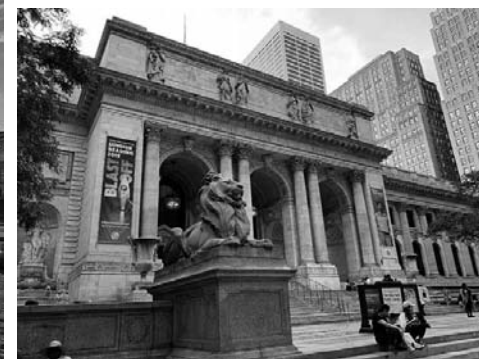
Vstup do reprezentativního sídla slavné Newyorské veřejné knihovny

to unikátní kombinace knihkupectví a restaurace Cook & Book. 2 Jen kousek od belgických hranic ve francouzském Lille můžeme navštívit vědecké a studijní centrum Lilliad (2016) zdejší univerzity.