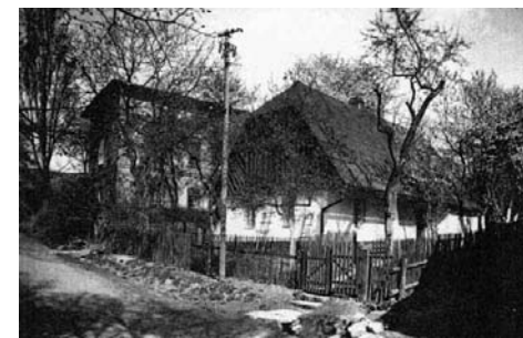
Budova české školy (1875), výuka do roku 1923; německá škola (chaloupka) 1872–1903