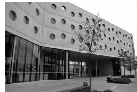
Moderní budova SVK v Hradci Králové