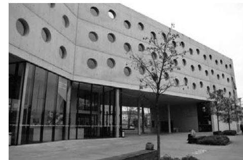
Moderní budova SVK v Hradci Králové