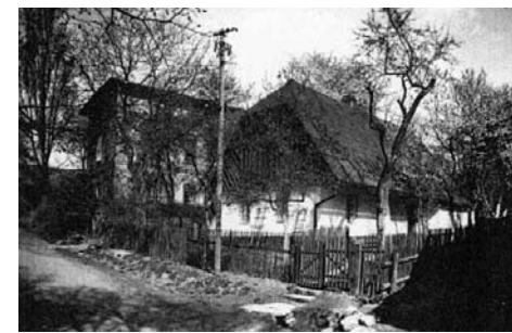
Budova české školy (1875), výuka do roku 1923; německá škola (chaloupka) 1872–1903