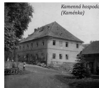
Kamenná hospoda (Kaménka)