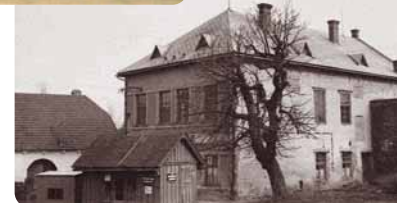
Od roku 1957 sídlila Městská knihovna Svratka v hostinci U Kaštanu na náměstí