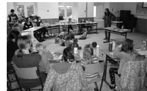
Klub Šalamounek v Chotěboři – program převážně pro děti předškolního věku

besedami o literatuře, seriálech a komiksech, prokládané filmovými projekcemi, hraním deskových i počítačových her a korunované workshopy všeho druhu. Mnozí čtenáři si začátek léta bez několika dnů strávených mezi svými v Chotěboři ani nedokáží představit a míří sem i autoři, redaktori a nakladatelé. Protože právě na tomto festivalu o sobě dávají vědět adeпти spisovatelského řemesla, hledají spřízněné duše, první čtenáře i kontakty pro vstup mezi literáty.