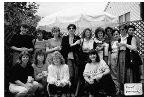
Absolventky stáže v Knihovně Kongresu z celkem čtrnácti zemí

Velmi bohatý a pro většinu účastnic až příliš náročný byl společenský program. Zde se mi velmi hodila zkušenost z Oxfordu a společenské akce jsem si v USA užívala. Program se měl