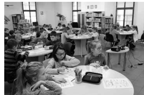
Beseda v Městské knihovně Jihlava

Najít vchod do Městské knihovny Jihlava je trochu oříšek, protože budovu bývalého jezuitského gymnázia, ve které dnes sídlí, stíní z náměstí monumentální kostel sv. Ignáce z Loyoly. Kláře