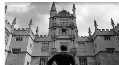
St. John's College v Oxfordu

Od událostí, které zde budu popisovat, uplynulo téměř třicet let. Pro přiblížení tehdejší situace a našich startovních podmínek popíši začátek svého pobytu v Oxfordu. V řadě jazykových učebnic je uvedena konverzace, kde si cestující kupuje na nádraží Paddington v Londýně jízdenku s místenkou do Oxfordu, takže jsem měla vše pečlivě nastudované. Na Paddingtonu jsem ovšem zjistila, že ani státní zkouška z angličtiny mi nestačí na to, abych si zde jízdenku bez problémů koupila. Úředníkovi tmavé pleti u přepážky jsem nerozuměla ani slovo a on evidentně nerozuměl mně. V následujících letech jsem na svých cestách potkala podobných úředníků spoustu a už mne to neznepokojovalo, ale tehdy jsem se velmi vyděsila při představě, že se anglicky