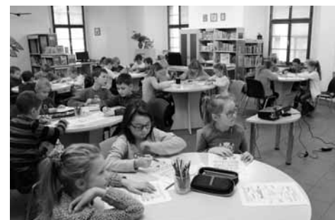
Beseda v Městské knihovně Jihlava