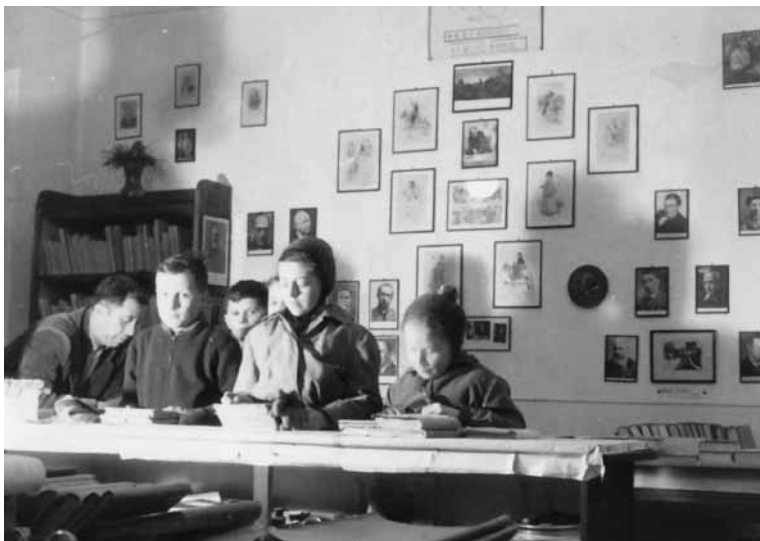
Interiér knihovny v hasičské zbrojnici