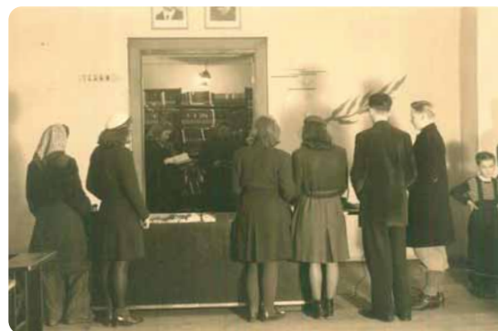
↑ Nedatovaný snímek půjčovny Husovy veřejné knihovny v Třebíči; podle brad státníků na čelní stěně (E. Beneš a J. V. Stalin) pochází nejspíš někdy z let 1945–1948