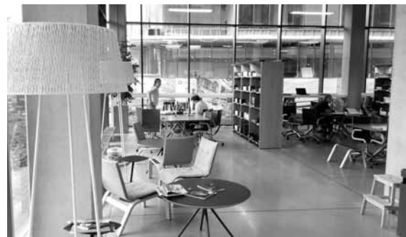
„Pestrá“ studijní místa v Akademickém centru Lotyšské univerzity

na je investice, která se vám v budoucnu zúročí. Do projektu byly začleněny výrazné národní prvky: vzor podlahy v přízemí připomíná lotyšské výšivky, jednotlivá patra barevně odpovídají barvám bankovek (dnes už bývalé) lotyšské měny lat, zábradlí a stěny v knihovně jsou obloženy dřevem lotyšské břízy. Knihovna má několik společenských sálů a spoustu výstavních prostor, takže tu může probíhat několik různých výstav současně. Poměrně ojedinělé je dětské oddělení, které má ale hlavně metodickou funkci a spíše než na děti se zaměřuje na budoucí dětské knihovníky. V knihovně je vystavena také Skříň lidových písní , do níž na konci 19. století folklorista Krišjānis Barons klasifikoval více než dvě stě tisíc lidových písní, tzv. dainů, které jsou v Lotyšsku vnímány jako národní poklad, a proto