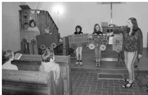
Beseda se čtenáři v evangelickém kostele v Horních Dubenkách o publikaci věnované husitství

mostatný a přitom na dosah regálů s knihami. Zní to jako samozřejmost, ale mnohé nové přednáškové sály knihoven působí neosobním dojmem, nejsou propojené se čtenářským tepem a vlastně v nich ani nepotkáte knižku. Když mezi regály místo vytvořit nelze, stěhuje se beseda do školy či na obecní úřad a pouto s knihovnou se může přetrhnout úplně.