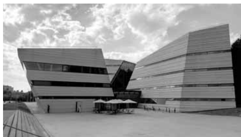
Budova jako z jiné planety – Vědecké komunikační a informační centrum Vilniuské univerzity

Riga je nejen hlavním městem Lotyšska, ale i největším městem v Pobaltí a logicky tu sídlí Národní knihovna Lotyšska (viz foto na 2. s. obálky). Její nová budova byla dokončena v roce 2014 a známá je také jako Palác světla (Gaismas pils). Její osudy v leccem připomenou příběh Kaplického blobu, ovšem s happyendem. Autorem projektu byl mezinárodně uznávaný lotyšský architekt Gunārs Birkerts, který ale většinu své kariéry působil v emigraci v USA. Budova knihovny je vůbec největším kulturním projektem Lotyšska v 21. století a slouží nejen jako knihovna, ale i jako kulturní, vědecké a vzdělávací centrum metropole. Knihovna se stala výrazem národní hrdosti Lotyšů a její otevření bylo předmětem celonárodních oslav. Přitom výstavba knihovny nebyla vůbec jednoduchá, protože probíhala v době, kdy se Lotyšsko vyrovnávalo s následky těžké ekonomické krize. Ani tehdy však Lotyšští nákladnou výstavbu nezastavili, protože knihov-