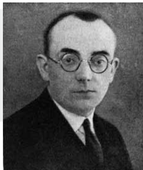
Stanislav Rambousek (1897–1937)

→ Za osvětovými zkušenostmi S. Rambousek podnikl řadu cest do ciziny a například v roce 1929 vystoupil za Československo na kongresu v Cambridgi. Ve své práci se řídil podobnými zásadami jako brněnský Jiří Mahen.