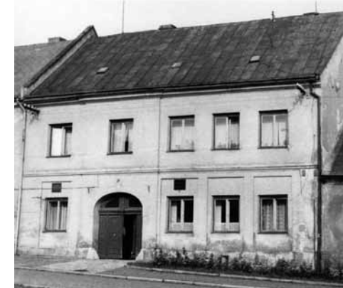
V roce 1946 byla knihovna přemístěna do budovy kampeličky