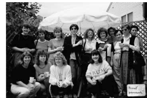
Absolventky stáže v Knihovně Kongresu z celkem čtrnácti zemí

Velmi bohatý a pro většinu účastnic až příliš náročný byl společenský program. Zde se mi velmi hodila zkušenost z Oxfordu a společenské akce jsem si v USA užívala. Program se měl