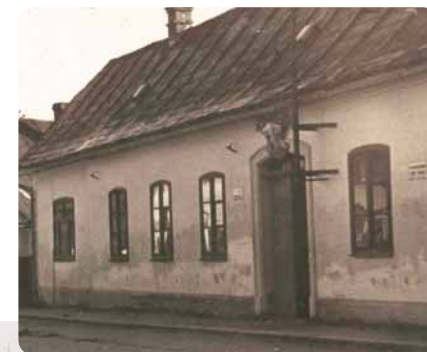
První sídlo měla Městská knihovna Svratka v budově radnice (1921–1946)