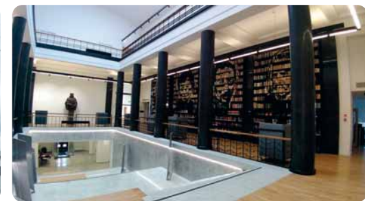
Pobaltí s. 401–403 Budovu Národní knihovny Lotyšska v Rize, která byla otevřena v roce 2014, často využívají jako kulisu pro své reportáže i naši televizní zpravodajové