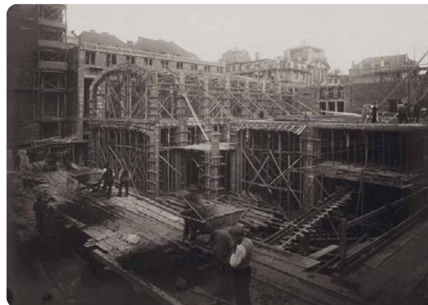
↑ Stavba tehdejší Ústřední knihovny hl. m. Prahy, která probíhala v letech 1925–1928