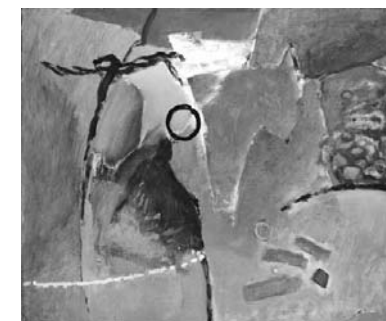
Jiří Patera: Horská krajina (1996)