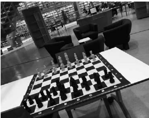
Šachový stůl v knihovně pro studenty Technické univerzity v Delftech, Nizozemsko

orientované na lidi, zároveň je tato práce větší- nou neviditelná, vůbec ne oslnivá, přitom je ale extrémně důležitá. A je třeba si jí vážít. 10