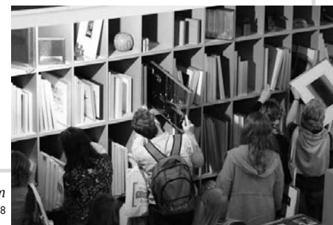
Artotéka „Raum für junge Kunst“ v Kolíně nad Rýnem Foto: Jochen Müller, 2018

→ Nejčastěji bývají artotéky součástí komunální či státní knihovny nebo muzea, které jim jsou přínosem buď po stránce akvizice uměleckých děl, nebo – v případě knihoven – poskytnutým konvolutem teoretických materiálů o výtvarném umění.