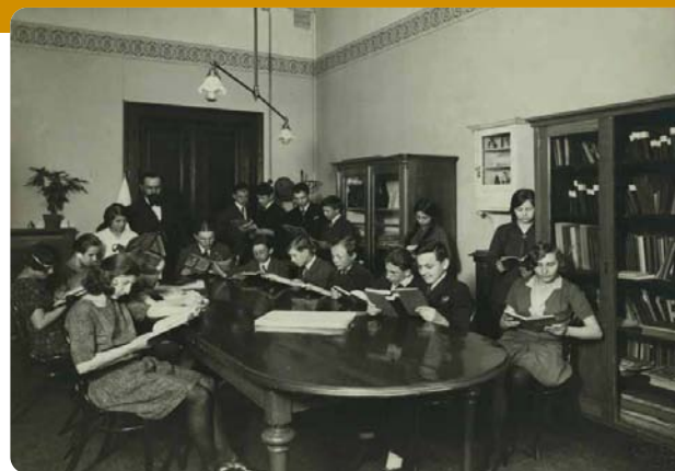
První knihovní zákon – 100 let: Praha a její knihovny s. 70–74