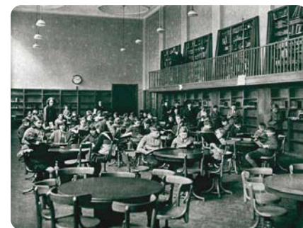
↑ Čítárna dětského oddělení (30. léta)