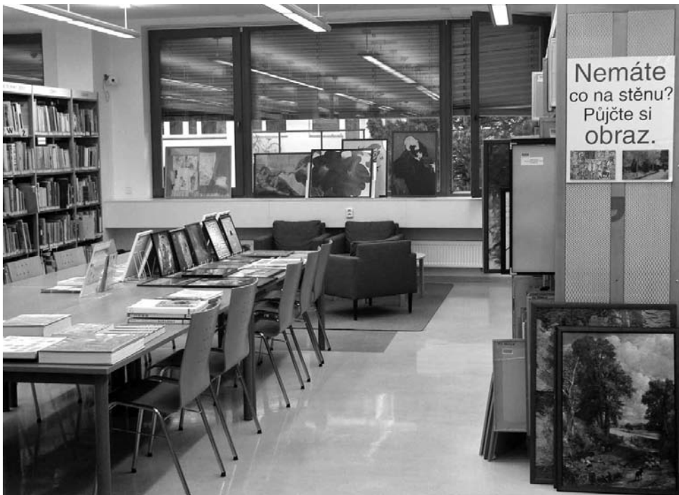
Interiér artotéky MKP v pobočce Opatov

Výpůjční doba pro reprodukce, grafické listy a jejich ochranné obaly (taška, tubus, desky) je 26 týdnů s možností prodloužení.