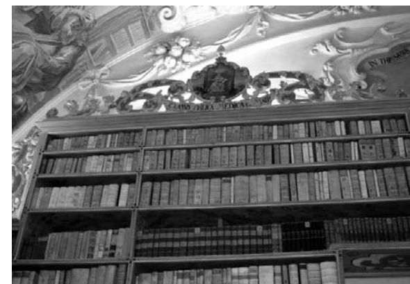
Interiér knihovny Strahovského kláštera

Spočítat počet poboček MKP se nám jeví jako úkol pro princeznu Koloběžku. Neustále totiž přibývají a číslo se podle nás pozvolna blíží k padesátce. Přestože se rádi zúčastňujeme nejrůznějších akcí pro čtenáře i knihovníky, které pražská městská knihovna pořádá, ve všech pobočkách jsme určitě nebyli. Když jsme však nedávno navštívili berounskou knihovnu, přišel se na dílnu