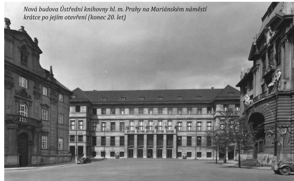
Nová budova Ústřední knihovny hl. m. Prahy na Mariánském náměstí krátce po jejím otevření (konec 20. let)

obecních knihoven 3 , některé dokonce starší než knihovna pražská: