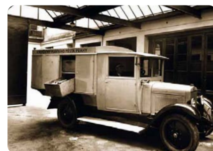
První bibliobus Knihovny hl. m. Prahy, který však byl v provozu pouze několik měsíců roku 1939, protože ho zrekvíroval wehrmacht pro potřeby lazaretu... →