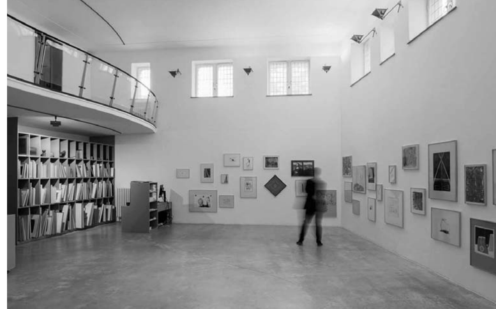
Výstavní prostory artotéky v Kolíně nad Rýnem