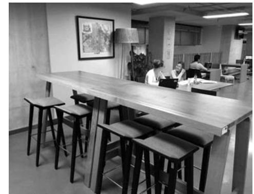
V knihovně jako v obýváku – propojení knihovny a kavárny v knihovně Lotyšské univerzity

Velmi přesně popisuje současnou situaci ame- rický sociolog Eric Klinenberg z New York Uni- versity , který se knihovně věnuje ve své nejno- vější knize Paláce pro lidi: jak může sociální infrastruktura pomoci v boji s nerovností, polari- zací společnosti a úpadkem občanského živo- ta . 18 Se spisovatelem Gaimanem se shoduje v tom, že odpovědné úřady a státní orgány pova-