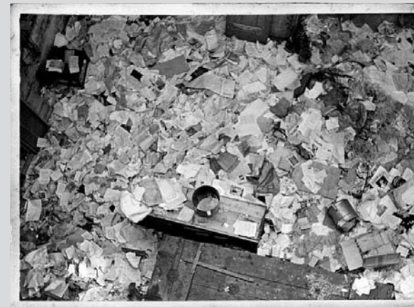
„Srovnané a zabezpečené“ knihy v Klášteře v Kadani