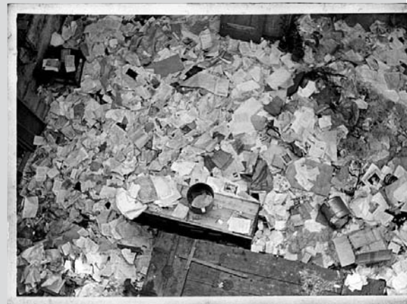
„Srovnané a zabezpečené“ knihy v Klášteře v Kadani