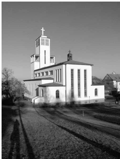
Kostel sv. Anežky České a patronů českých v Praze na Spořilově

Sama, povoláním knihovnice, se jaksi přirozeně starám o knihovnu ve farnosti u kostela svatě Anežky České v Praze na Spořilově. Naše farnost vždy žila dosti intenzivním kulturním životem, knihovna zde byla založena záhy po dostavění a vysvěcení kostela. Naše farní knihovna je tu, díky otci Mikuláši Šusovi, už od roku 1938. Doplnovala se až do roku 1950 za pátera Cyrila Kadlece. Před rokem 1968 se politická situace trochu uvolnila. Zásluhou pražského jara přišel 1. 6. 1969 na Spořilov otec Řehoř Mareček, který zde působil téměř čtyři desítky let. Pán mu dopřál, že zde mohl zůstat prakticky až do své smrti. Páter Řehoř byl znalcem literatury, milovníkem poezie, hudby, divadla. Sám psal verše, které publikoval pod pseudonymem Klement Plucha. Dobře a rád si zazpí-