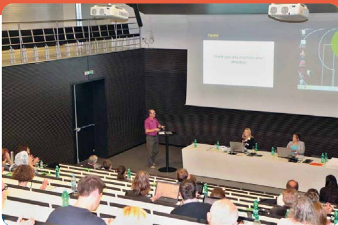
Šedá konference pojednání s. 390 Prezentace kolegů z University of Constantine v Alžíru