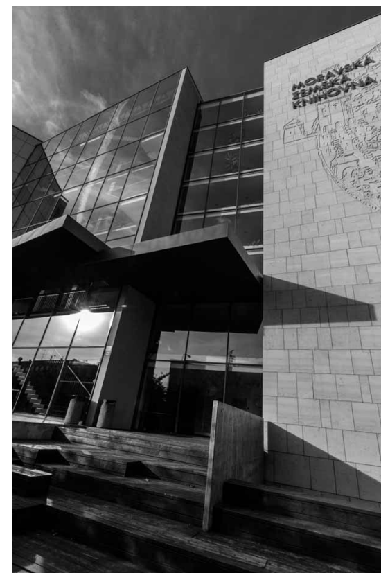
MZK sídlí v nové budově od roku 2001

Máme už za sebou druhý ročník soutěže, která je mnohem úspěšnější, než jsem doufal. Nápad na její uspořádání vyšel od nás, podařilo se nám pro něj nadchnout břeclavského ředitele knihovny