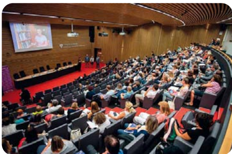
Medaile Z. V. Tobolky s. 392–393 Pohled na auditorium během předávání ocenění