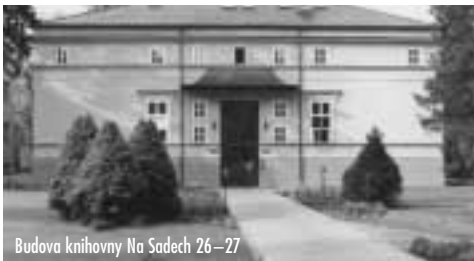
Budova knihovny Na Sadech 26-27