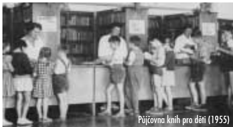
Půjčovna knih pro děti (1955)

Je to dobře? Je to špatně? Jak pro koho. Ten, kdo se nechce hnout od počítače, přichází o mnohá setkání s lidmi cestou do knihovny i v knihovně, o radost listovat v knihách, nahlédnout koutkem oka na konec detektivky, porovnat tloušťku skript nebo učebnic, ze kterých má studovat; zjistit, zda kniha o zakládání záhonů má barevné a pěkné obrázky a podobně. Čtenář, který nemá vůbec čas, protože buď musí hlídat děti, nebo je nemocný, nebo na služební cestě, si rychle a bezpečně prostřednictvím internetu výpůjčku prodlouží či si zamluví něco nového a do knihovny si pro to pouze zaběhne, nebo ty staré a přečtené rychle vrátí a přechá opět za svými úkoly a povinnostmi.