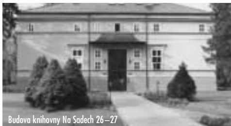
Budova knihovny Na Sadech 26–27