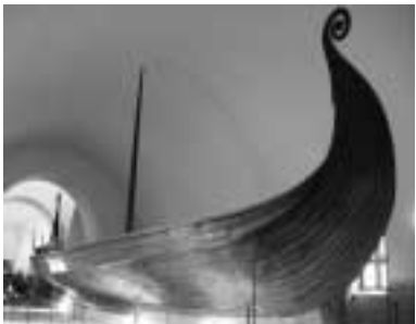
Vikingská loď, jejíž příď se stala logem a symbolem 71. kongresu IFLA