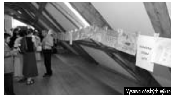
Výstava dětských výkresů