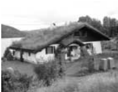
Norský venkovský dům