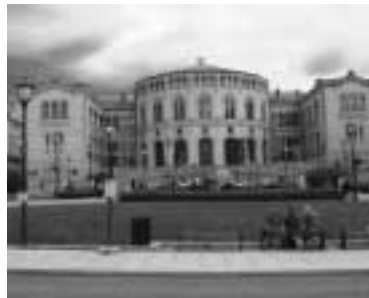
Královský palác v Oslu

protože obě knihovny jsou svou velikostí, počtem pracovníků, paletou služeb i mezinárodní spoluprací téměř totožné. Pro srovnání jen několik čísel (na prvním místě Norové, na druhém my):