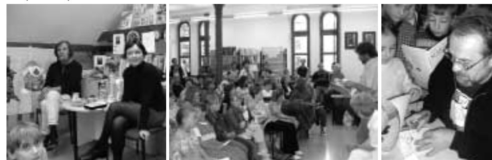
Besedy dětí s autory

Situace se mírně zkomplikovala, když si město Uherské Hradiště vyžádalo návrat historického majetku (objekt se stal kulturní památkou) a knihovna, stále zařízení okresního úřadu, se