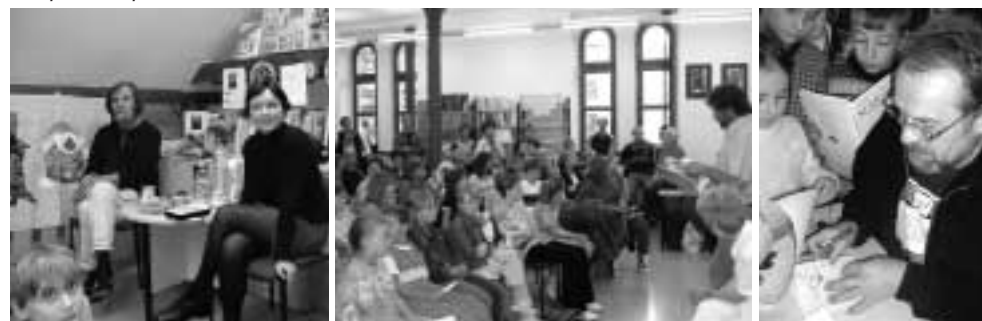
Besedy dětí s autory

Situace se mírně zkomplikovala, když si město Uherské Hradiště vyžádalo návrat historického majetku (objekt se stal kulturní památkou) a knihovna, stále zařízení okresního úřadu, se