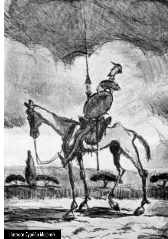
Ilustrace Cyprián Majerník

Karel Souček se zabýval Donem Quijotem prakticky během celého svého dlouhého tvůrčího období od prvních náčrtů datovaných rokem