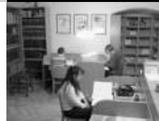
Badatelé mají ke své práci v badatelském centru Krajského muzea Cheb důstojné prostředí.

Už téměř rok je v provozu Regionální badatelské centrum Krajského muzea Cheb. Poskytování badatelských služeb není pro muzeum nic nového. Prvně se však odehrává v důstojném prostředí, při vhodném osvětlení a s technickým vybavením, které jsme dosud neměli. Knihovna nabízí takřka 20 000 svazků knih studijního a sbírkového fondu, z toho přes 5000 regionálních publikací. Čtenářům je k dispozici 60 titulů periodik.