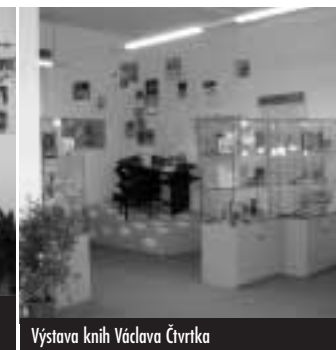
Výstava knih Václava Čtvrťka