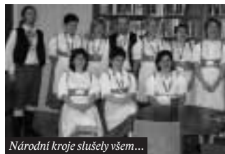
Národní kroje slušely všem...

V sobotu 28. října 2006 byla ve středních Čechách otevřena veřejnosti všechna muzea, galerie a další kulturní zařízení, která má Středočeský kraj ve své správě. Vstup pro návštěvníky byl zdarma.