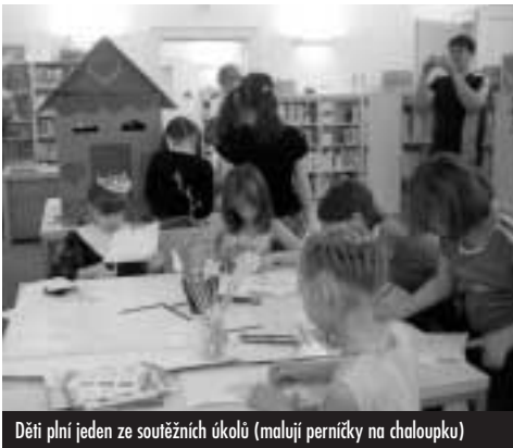
Děti plní jeden ze soutěžních úkolů (malují perníčky na chaloupku)