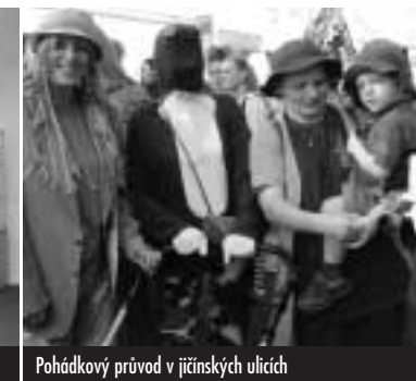
Pohádkový průvod v jičínských ulicích