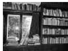
Knihovna pražského sboru Obce křesťanů v ČR je lokalizována v místnosti, která slouží i jiným účelům souvisejícím s životem církve, a to například k ubytování návštěv.

Starokatolickou církev v ČR tvoří 15 obcí, z toho v pěti z nich existují knihovny pro veřejnost. Starokatolická knihovna v Praze je největší z nich a v rámci církve funguje jako centrální knihovna.