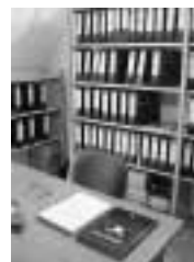
Část fondu a pracovní místo archiváře Archivu apoštolského exarchátu řeckokatolické církve.

Pět knihoven během několika posledních let prošlo, případně právě prochází nějakou zásadní perspektivní změnou, jako je například rekonstrukce, 10 přestěhování, 11 lepší personální zajištění, 12 organizační změna 13 a jiné. Zástupci osmi knihoven si naopak určité progresivní změny v blízké budoucnosti dali za cíl.