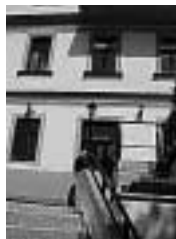
Budova ústředí Starokatolické církve, v níž se nachází Starokatolická knihovna v Praze, pochází z doby první republiky, vyhořela a byla výhodně prodána Starokatolické církvi pod podmínkou, že bude zrekonstruována do původní podoby.

Archiv byl založen v roce 1993 společně s biskupským vikariátem, který byl v roce 1996 povýšen na apoštolský exarchát.