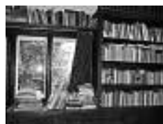
Knihovna pražského sboru Obce křesťanů v ČR je lokalizována v místnosti, která slouží i jiným účelům souvisejícím s životem církve, a to například k ubytování návštěv.

Starokatolickou církev v ČR tvoří 15 obcí, z toho v pěti z nich existují knihovny pro veřejnost. Starokatolická knihovna v Praze je největší z nich a v rámci církve funguje jako centrální knihovna.