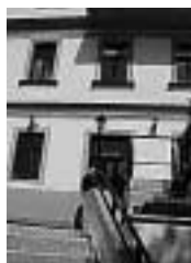
Budova ústředí Starokatolické církve, v níž se nachází Starokatolická knihovna v Praze, pochází z doby první republiky, vyhořela a byla výhodně prodána Starokatolické církvi pod podmínkou, že bude zrekonstruována do původní podoby.

Archiv byl založen v roce 1993 společně s biskupským vikariátem, který byl v roce 1996 povýšen na apoštolský exarchát.