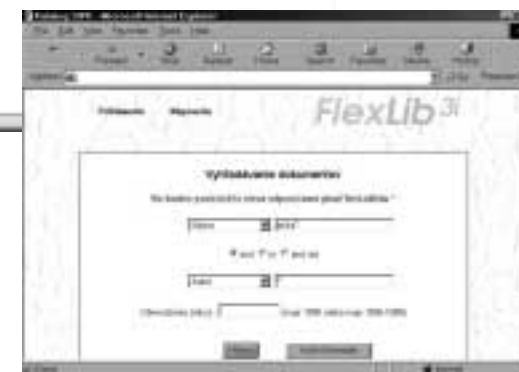
Obr. 5 Formulace dotazu (2)

5. Poslední námět: stojí za úvahu zorganizovat a odborně garantovat vzdělávací seminář například s názvem: Vyhledávání v online ka-