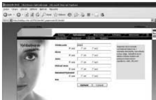
Obr. 4 Formulace dotazu (1)

2. Přístup ke katalogu by měl být co nejjednodušší. Jednotlivé knihovnické systémy mají své principy a limity, ale žádný z testovaných systémů nevyžaduje, aby se člověk musel k oknu pro zadávání vyhledávacího řetězce proklikávat z hlavní stránky až třemi hierarchickými úrovněmi, stačí jedna, nejvýš dvě.