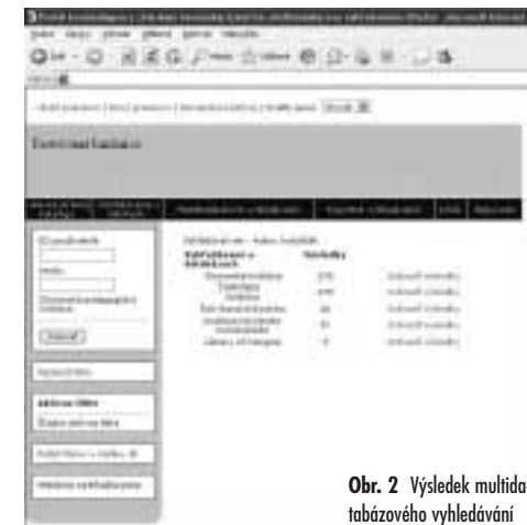
Obr. 2 Výsledek multidatabázového vyhledávání