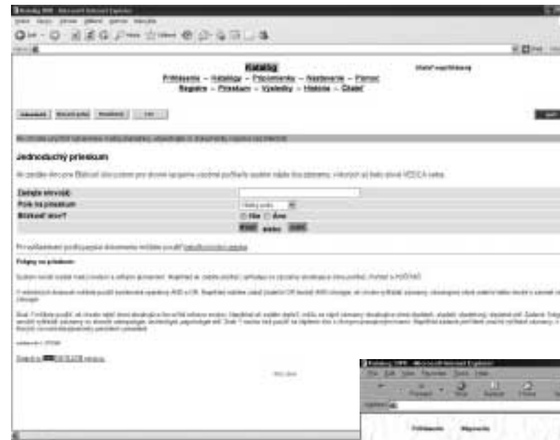
Obr. 6 Formulace dotazu (3)

Heslo by rovněž nemuselo být od čtenáře požadované hned na začátku práce, ale až při zájmu o rezervaci či výpůjčku. I neregistrovaný zájemce by měl mít možnost vidět, zda je kniha k dispozici, nebo jestli je půjčená.