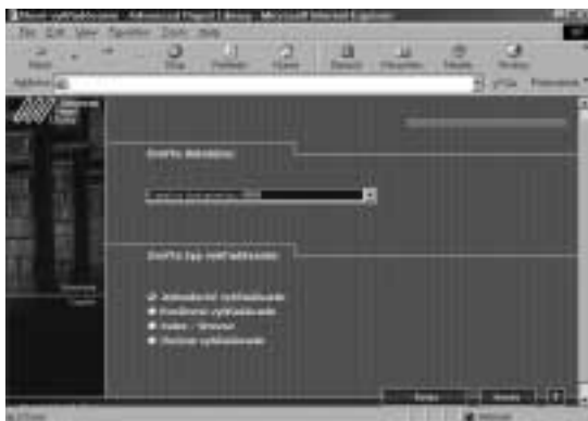
Obr. 3 Výběr typu vyhledávání

Ne všechny knihovny , využívající tento knihovní software, nabízejí všechny z uvedených vyhledávacích kritérií. Zajímavé by asi bylo statistické zjištění, kolik z nich při své práci prakticky využijeme?