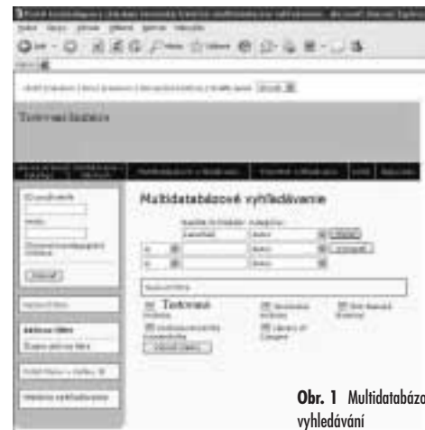
Obr. 1 Multidatabázové vyhledávání