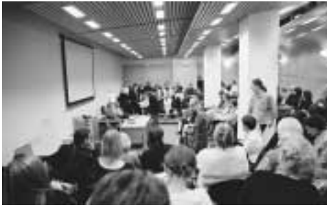
Konferenční místnost MKC