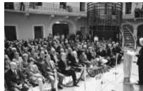
Otevření knihovny 17. 4. 2005

Standardní předprojektová a projektová fáze každé investice vyžaduje obvykle více času, který v tomto případě nebyl k dispozici. Etapa přípravných prací (průzkumy, projekty, veřejné zadávání) byla opravdu krátká, avšak delší vzhledem k plánovanému termínu realizace. Bylo nutné vystěhovat, přemístit a přestavět asi dva miliony knih, což do té doby na Slovensku a ještě ke všemu za provozu, nikdo nedělal. Stavební práce začaly v srpnu 2002, ale až do dubna 2003 se knihy půjčovaly a studovny fungovaly, i když to probíhalo v prostředí zvyšují-