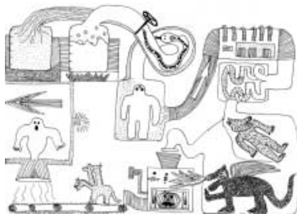
Jeden z obrázků zařazených do almanachu dětských prací 2005

Obrázky posledního ročníku, inspirovaného rokem H. Ch. Andersena, navrhuji, jak by měl asi vypadat „kouzelný stroj na výrobu pohádek“. A co všechno na obrázcích našich dětí dokáže vykouzlit pohádku? Kromě opravdu složitých soustrojí např. na bázi kafe mlýnku, z něhož vypadávají pohádkové postavičky, také třeba sen, vznášející se nad pruhovanou duchnou, který vybývá ty nejneuvěřitelnější fantazie, nebo osoba spisovatele či spisovatelky, kteří dokážou vidět svět jinak než my ostatní. To všechno mohou být v dětských představách stroje na výrobu pohádek.