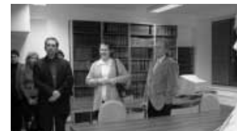
Nahoře: olomoucká konference je tradičním místem setkávání knihovníků, historiků a archivářů. Dole: součástí programu byla i prohlídka nových studoven knihovny