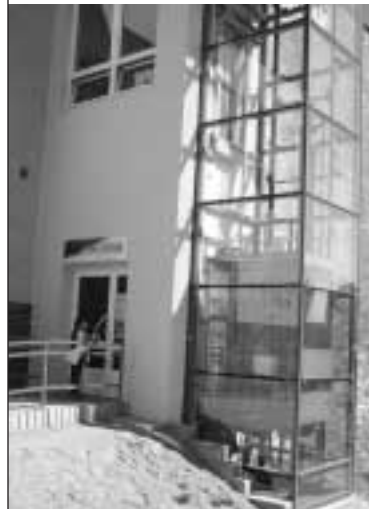
Bezbariérový přístup do Obvodní knihovny Plzeň-Lochtín s dominantou proskleného bezbariérového výtahu

věnujeme zvýšenou pozornost. Jejich dotazy a požadavky patří k nejnáročnějším. Snažíme se jim ve všech směrech vyhovět, pomáháme jim s vypracováním referátů i odborných a vědeckých prací. Pro děti ze základních a mateřských škol pořádáme výchovné lekce, exkurze a besedy o knihovně a knihách. Připravujeme pro ně zajímavé soutěže o ceny, které jsou velkou motivací k návštěvě knihovny a také ke čtení knih.“