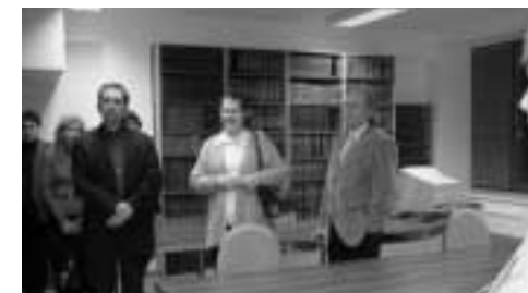
Nahoře: olomoucká konference je tradičním místem setkávání knihovníků, historiků a archivářů. Dole: součástí programu byla i prohlídka nových studoven knihovny