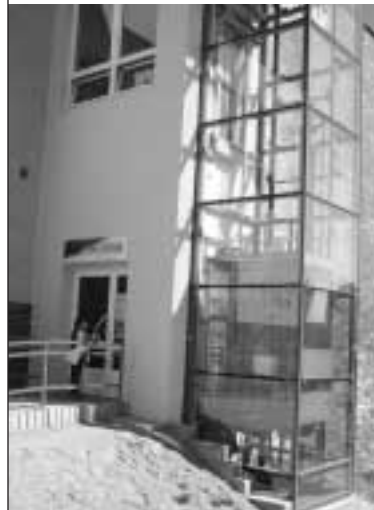
Bezbariérový přístup do Obvodní knihovny Plzeň-Lochtín s dominantou proskleného bezbariérového výtahu

věnujeme zvýšenou pozornost. Jejich dotazy a požadavky patří k nejnáročnějším. Snažíme se jim ve všech směrech vyhovět, pomáháme jim s vypracováním referátů i odborných a vědeckých prací. Pro děti ze základních a mateřských škol pořádáme výchovné lekce, exkurze a besedy o knihovně a knihách. Připravujeme pro ně zajímavé soutěže o ceny, které jsou velkou motivací k návštěvě knihovny a také ke čtení knih.“