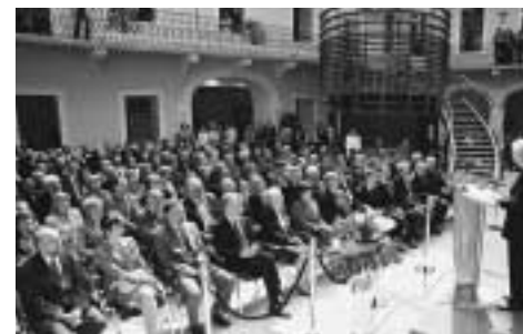
Otevíření knihovny 17. 4. 2005

Standardní předprojektová a projektová fáze každé investice vyžaduje obvykle více času, který v tomto případě nebyl k dispozici. Etapa přípravných prací (průzkumy, projekty, veřejné zadávání) byla opravdu krátká, avšak delší vzhledem k plánovanému termínu realizace. Bylo nutné vystěhovat, přemístit a přestavět asi dva miliony knih, což do té doby na Slovensku a ještě ke všemu za provozu, nikdo nedělal. Stavební práce začaly v srpnu 2002, ale až do dubna 2003 se knihy půjčovaly a studovny fungovaly, i když to probíhalo v prostředí zvyšují-