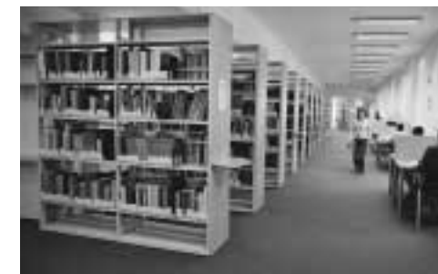
Studijní místa a volný výběr dokumentů

Jedna věc je stavět jakoukoli novostavbu na „zelené louce“, jiná rekonstruovat starou budovu. Můžeme potvrdit, parafrázujíc kterýkoliv z Murphyho zákonů, že když se něco nemá najít, tak se to najde. Zdatní archeologové zbytky jakési hospodářské stavby ze 16. století na parcele pod Lisztovou zahradou skutečně našli, ačkoli geologické a geofyzikální sondy to