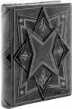
Ukázka kubistické knižní vazby