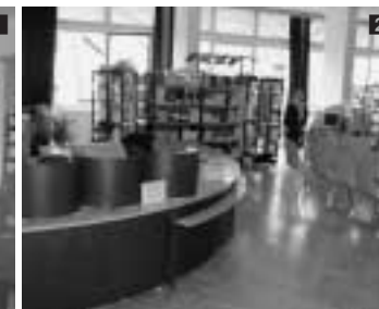
1 Centrální místnost Knihovny pro mladé Romy Gándhího gymnázia v maďarské Pécsi, Maďarsko (červen 2005)