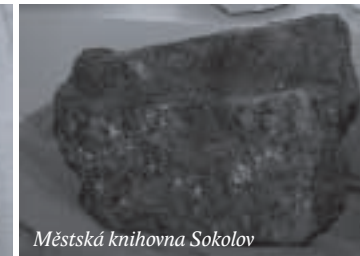
Městská knihovna Sokolov