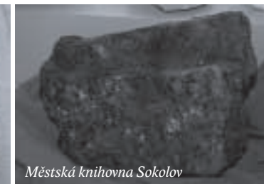
Městská knihovna Sokolov