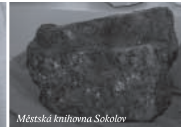
Městská knihovna Sokolov