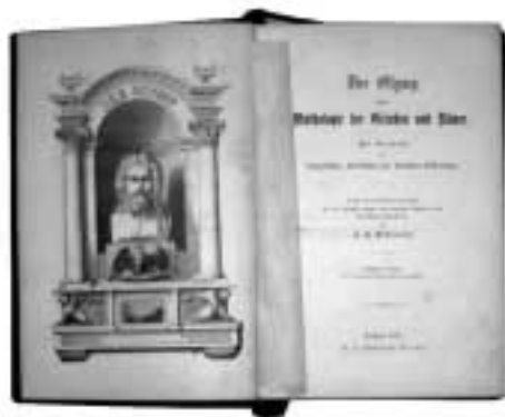
Der Olymp oder Mythologie der Griechen und Römer: mit Einschluß der Aegyptischen, Nordischen und Indischen Götterlehre / J. A. Petiscus. vyd. 1878 – nejstarší kniha, titulní list

Její největším problémem je absence jakékoli organizace fondu. Dosud nebylo zvoleno žádné řazení a knihy jsou do regálů pokládány zcela namátkově, popř. tak, aby zabíraly co