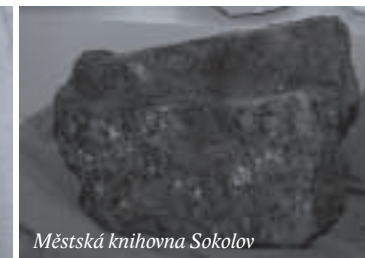
Městská knihovna Sokolov