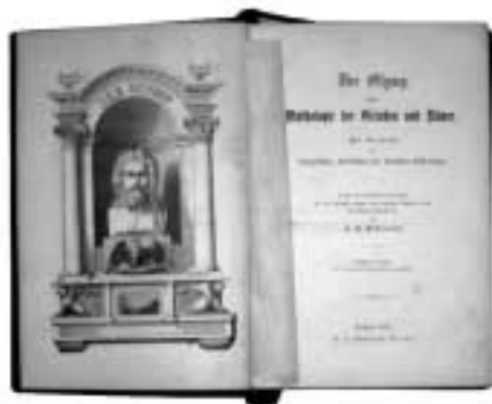
Der Olymp oder Mythologie der Griechen und Römer: mit Einschluß der Aegyptischen, Nordischen und Indischen Götterlehre / J. A. Petiscus. vyd. 1878 – nejstarší kniha, titulní list

Její největším problémem je absence jakékoli organizace fondu. Dosud nebylo zvoleno žádné řazení a knihy jsou do regálů pokládány zcela namátkově, popř. tak, aby zabíraly co