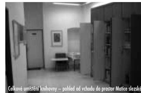
Celkové umístění knihovny – pohled od vchodu do prostor Matice slezské

Krátce jsem se zmínil o ČNB. Musím jí však věnovat větší pozornost, protože společně se Souborným katalogem periodik ČR či elektronickým katalogem KPB patří k hlavním nástrojům, které při popisu využívám. Všechny bibliografické záznamy knih, časopisů popř. dalších dokumentů vyhledávám v těchto databázích. Nalezené hity pak ve formátu ISBD stahuji do textového editoru a na lokální počítač, kde poté dochází k jejich úpravám, doplnění, popř. opravám. Jako nepostradatelný pomocník se také ukázal knihovnický portál The European Library, jehož prostřednictvím vstupuji na webové stránky národních bibliografií a souborných katalogů v Polsku, Německu nebo na Slovensku. I přes tyto moderní postupy mi však někdy nezbyvá, než se uchýlit k tradiční metodě de visu , především v případě úzce regionálních publikací a letáků, které v ČNB nenajdeme. Elektronické katalogy a ČNB mi v mnohém ulehčily práci, přesto by se našlo pár případů, kdy bych raději volil odlišný postup popisu a tvorby záhlaví. Proto některé zkopírované záznamy upravuji a zkracuji. Celý tento proces jsem pracovně nazval „poloautomatickou katalogizací“.