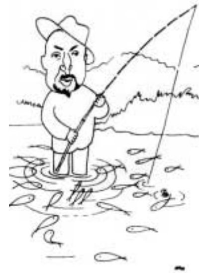
Mahen rybář – ilustrace Adolfa Hoffmeistra k článku F. Halase (Panorama, 8, 1931, s. 91)

Na to jakoby navazuje Mahenův vztah ke zřizovatelům a nadřízeným institucím. Vyznačoval se neohrožeností, s jakou kritizoval obce, politiky a veřejnost za nedostatečnou starost a péči o veřejné knihovny – instituce národní, tedy i jejich. V Listu, který nebyl ovšem nikam poslán. Čs. politikům (Tvorba, 1927, č. 1) Mahen morálně apeloval: „ Starejte se trochu více o nás (...). Je pravda, že se od převratu na poli lidové výchovy udělalo hojně práce, ale je pravda, že asi od roku 1923 trčíme a že nám na pomoc nejedete. “