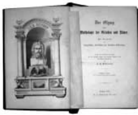
Der Olymp oder Mythologie der Griechen und Römer: mit Einschluß der Aegyptischen, Nordischen und Indischen Götterlehre / J. A. Petiscus. vyd. 1878 – nejstarší kniha, titulní list

Její největším problémem je absence jakékoli organizace fondu. Dosud nebylo zvoleno žádné řazení a knihy jsou do regálů pokládány zcela namátkově, popř. tak, aby zabíraly co