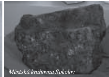
Městská knihovna Sokolov