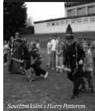
Soutěžní klání s Harry Potterem