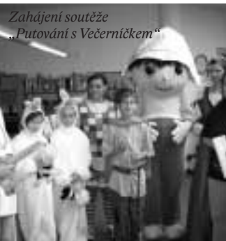
Zahájení soutěže „Putování s Večerníčkem“