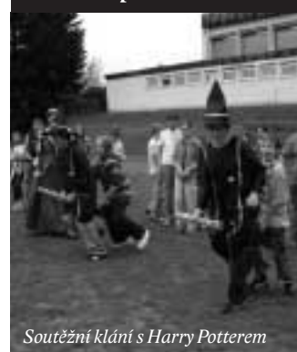
Soutěžní klání s Harry Potterem