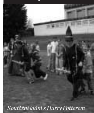
Soutěžní klání s Harry Potterem