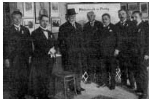
T. G. Masaryk na knihovnické výstavě

Mezi další Tobolkovy zásluhy patří zrod a rozvoj knihovnického vzdělávání. V roce 1920 inicioval založení Státní knihovnické školy a stal se jejím prvním ředitelem. Škola vychovávala kvalifikované knihovníky pro všechny