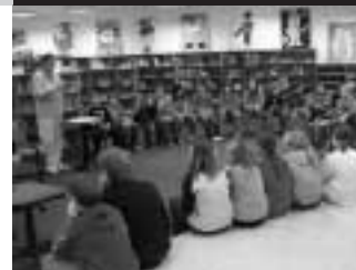
Městská knihovna Tišnov

Koncem loňského léta vyhlásil Klub dětských knihoven SKIP spolu s firmou 3M Česko první ročník soutěže Kamarádka knihovna , do níž se mohly přihlásit všechny knihovny s dětským oddělením. Ty pak dostávaly formou vysvědčení hlasy od svých čtenářů. Možnost známkovat knihovny se dětem velice líbila, opravdu se snažily, až