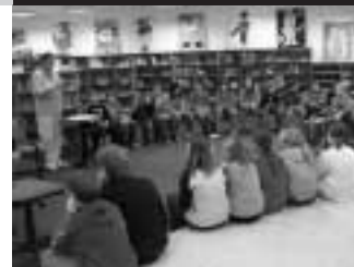
Městská knihovna Tišnov

Koncem loňského léta vyhlásil Klub dětských knihoven SKIP spolu s firmou 3M Česko první ročník soutěže Kamarádka knihovna , do níž se mohly přihlásit všechny knihovny s dětským oddělením. Ty pak dostávaly formou vysvědčení hlasy od svých čtenářů. Možnost známkovat knihovny se dětem velice líbila, opravdu se snažily, až