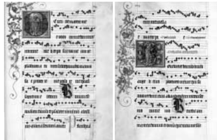
vlevo: foto z folia 134: iniciála „D“ e ventre (100x103 mm), sv. Jan Křitel s knihou a Beránkem Božím s korouhví.

Vraťme se ještě k bližšímu popisu vzácného kodexu. Text graduálu doprovází 154 honosnějších, filigránem zdobených iniciál, 18 malířsky zdobených iniciál obsahuje miniaturu se scénickou figurální kompozicí, převážně světců, někdy i s legendou. Celou plochu vnějšího okraje stránky zaujímá souvislý ornamentální pás, lemovaný ozdobnou lištou. Vazba rukopi-