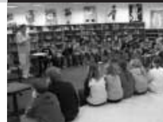
Městská knihovna Tišnov

Koncem loňského léta vyhlásil Klub dětských knihoven SKIP spolu s firmou 3M Česko první ročník soutěže Kamarádka knihovna , do níž se mohly přihlásit všechny knihovny s dětským oddělením. Ty pak dostávaly formou vysvědčení hlasy od svých čtenářů. Možnost známkovat knihovny se dětem velice líbila, opravdu se snažily, až