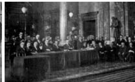
Ze zahajovací schůze mezinárodního sjezdu knihovnického

typy knihoven. Pro tuto školu také připravil s ostatními kolegy učebnice nesoucí název Československé knihovnictví . Učebnice vyšla v roce 1925 a později sloužila i pro studenty knihovně na Karlově univerzitě. O zavedení výuky knihovně na Filozofické fakultě Karlovy univerzity usiloval Tobolka již před válkou, ale jeho snahy se nesetkaly s úspěchem. Až v roce 1926 podává opět žádost o habilitaci na docenta knihovnických věd, což bylo předpokladem k otevření kurzu. V následujícím roce se Tobolkovi podařilo habilitaci získat a od podzimního semestru roku 1927 začala výuka knihovnictví v rámci pomocných věd historických. V této době opouští pozici ředitele Státní knihovnické školy a plně se věnuje výuce na Karlově univerzitě.