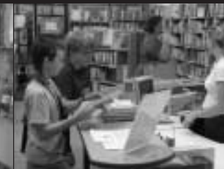
Městská knihovna Havířov