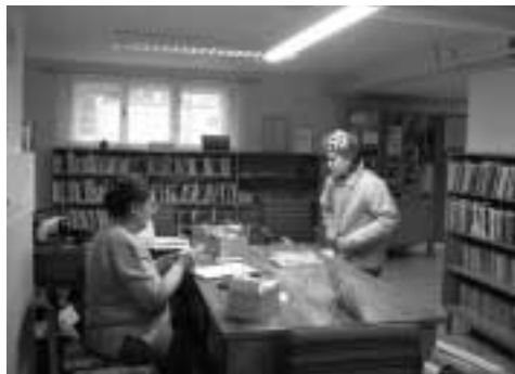
Stále aktivní – na pobočku v Prokopě dochází každý čtvrtek