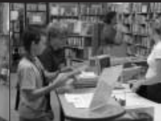
Městská knihovna Havířov