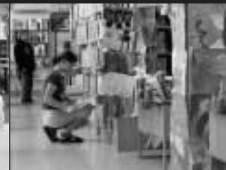
Městská knihovna Sedlčany

se za necelý rok sešlo obdivuhodných 18 000 vysvědčení. Kromě přízně dětí však knihovny musely také prokázat, že mají kvalitní fond, vstřícnou otevírací dobu, moderní a atraktivní prostředí a dostatečné technické zabezpečení. Hodnotila se také spolupráce s obcí, školami a dalšími zařízeními a pestrost aktivit, které knihovny nejen pro své čtenáře organizují. Podmínky tedy nebyly lehké, přesto se do soutěžení pus-