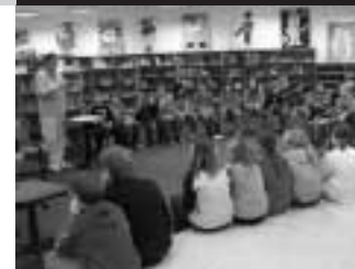
Městská knihovna Tišnov

Koncem loňského léta vyhlásil Klub dětských knihoven SKIP spolu s firmou 3M Česko první ročník soutěže Kamarádka knihovna , do níž se mohly přihlásit všechny knihovny s dětským oddělením. Ty pak dostávaly formou vysvědčení hlasy od svých čtenářů. Možnost známkovat knihovny se dětem velice líbila, opravdu se snažily, až