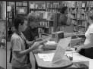
Městská knihovna Havířov