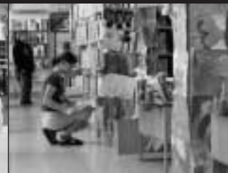
Městská knihovna Sedlčany

se za necelý rok sešlo obdivuhodných 18 000 vysvědčení. Kromě přízně dětí však knihovny musely také prokázat, že mají kvalitní fond, vstřícnou otevírací dobu, moderní a atraktivní prostředí a dostatečné technické zabezpečení. Hodnotila se také spolupráce s obcí, školami a dalšími zařízeními a pestrost aktivit, které knihovny nejen pro své čtenáře organizují. Podmínky tedy nebyly lehké, přesto se do soutěžení pus-