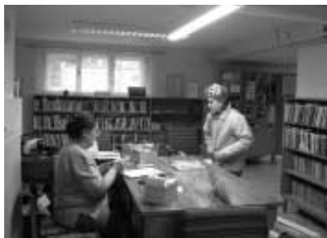
Stále aktivní – na pobočku v Prokopě dochází každý čtvrtek