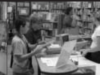
Městská knihovna Havířov