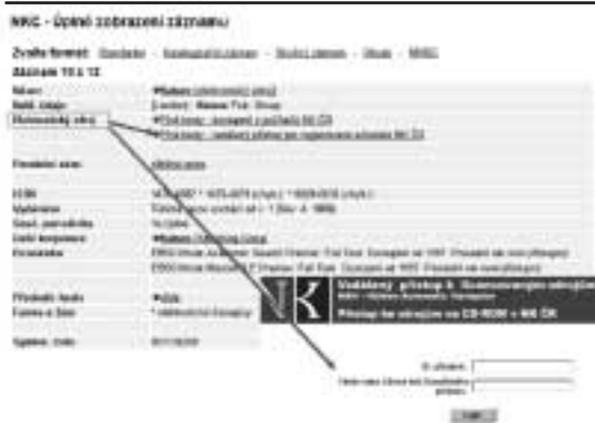
Příklad – záznam časopisu Nature z báze NKC, který je dostupný v plném textu (v bázi EBSCO) i mimo knihovnu prostřednictvím vzdáleného přístupu.

Pro přihlášení do systému využívá NK ČR stejné přihlašovací údaje, které čtenáři používají při objednání dokumentů v on-line katalogu – bázi NKC a katalogu Slovanské knihovny. Systém obsahuje informace o všech on-line licencovaných zdrojích NK ČR,