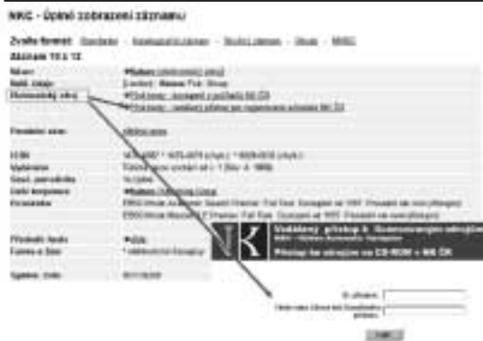
Příklad – záznam časopisu Nature z báze NKC, který je dostupný v plném textu (v bázi EBSCO) i mimo knihovnu prostřednictvím vzdáleného přístupu.

Pro přihlášení do systému využívá NK ČR stejné přihlašovací údaje, které čtenáři používají při objednání dokumentů v on-line katalogu – bázi NKC a katalogu Slovanské knihovny. Systém obsahuje informace o všech on-line licencovaných zdrojích NK ČR,