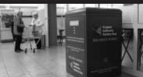
Bibliobox v ZŠ Stará Role