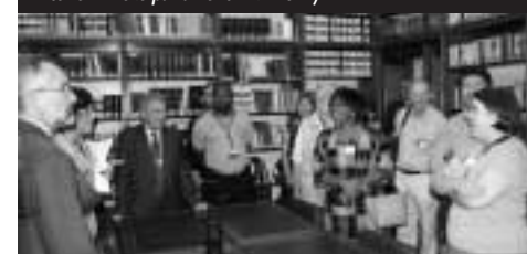
Interiér římské parlamentní knihovny

Na tuto konferenci navázal 23.–27. 8. 2009 Světový knihovnický a informační kongres: 75. generální konference a shromáždění IFLA v Miláně . Hlavní motto tentokrát znělo Knihovny tvoří budoucnost: budování kulturního dědictví . Pro představu o velikosti a světovém významu kongresu uvádím pár čísel. Přijelo na něj 3139 delegátů ze 127 zemí, z toho 1079 poprvé v životě. Nejvyšší počet účastníků