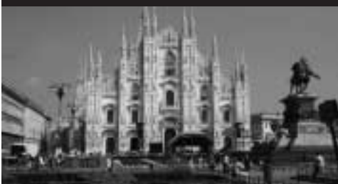
Milánské náměstí s dómem

Na kongresu jsem navštívil všechny akce, na kterých se podílela sekce Parlamentní knihovny a výzkumné služby pro parlamenty. Byly mezi nimi dvě schůze stálého výboru sekce, všem účastníkům kongresu přístupné semináře na téma Parlamentní knihovny v minulosti, současnosti a budoucnosti a Využití moderních informačních technologií v parlamentních knihovnách pro řízení a sdílení znalostí v hlavním kongresovém středisku a workshop ředitelů parlamentních knihoven a výzkumných parlamentních služeb v sídle regionálního lombardského parlamentu.