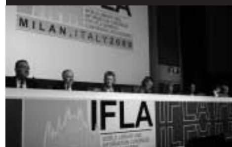
Předsednictvo sekce IFLA v Miláně

Ve dnech 19.–21. 8. 2009 se v italském parlamentě, v těsném sousedství římského Pantheonu, konala 25. výroční konference sekce IFLA – Knihovny a výzkumné služby pro parlamenty . Ústřední téma znělo Digitální informace pro demokracii: řízení, přístup a uchování . Přes 100 pracovníků parlamentních knihoven a dalších parlamentních výzkumných, analytických a informačních služeb zde po tři dny v nádherném inspirujícím prostředí „ostrova moudrosti“ (insula sapientiae) bývalého dominikánského kláštera intenzivně diskutovalo nejruznější aspekty vytváření, získávání, šíření a uchování digitálních informací, problematiku digitalizace vlastních parlamentárií a jejich zpřístupňování zákonodárcům a široké veřejnosti a spolupráci na digitalizačních projektech na národní i mezinárodní úrovni.