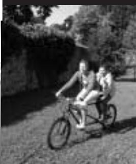
Jízda na tandemovém kole