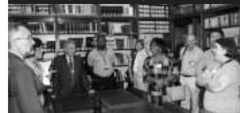
Interiér římské parlamentní knihovny

Na tuto konferenci navázal 23.–27. 8. 2009 Světový knihovnický a informační kongres: 75. generální konference a shromáždění IFLA v Miláně . Hlavní motto tentokrát znělo Knihovny tvoří budoucnost: budování kulturního dědictví . Pro představu o velikosti a světovém významu kongresu uvádím pár čísel. Přijelo na něj 3139 delegátů ze 127 zemí, z toho 1079 poprvé v životě. Nejvyšší počet účastníků