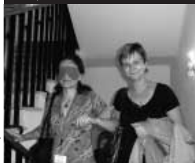
Návlek prostorové orientace