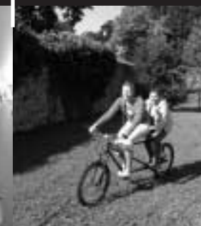
Jízda na tandemovém kole