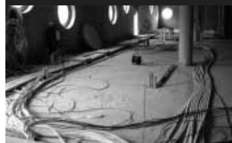
Kabeláž v SVK v Hradci Králové

kabeláže, aby výpočetní technika mohla pracovat. V nové městské knihovně v Ulmu si dali práci a spočítali jejich délku – bylo to sto tisíc metrů kabelů.