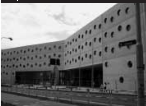
Studijní a vědecká knihovna v Hradci Králové

Ale Koolhaasově knihovně by asi slušel i název kultovní knihovna , protože jako se vůči Kaplického chobotnici vymezují čeští odborníci i občanská iniciativa Demokracie staví, k seattleské se vymezují i knihovničtí na celém světě. Na málokterém semináři ve světě chyběl většinou pochvalný referát o této knihovně, vždy s několika zajímavými fakty: knihovna stojí na tak exponovaném místě, že tu původní dala městská správa zbourat a na jejím místě postavit novou, knihovna má z obyvatel města (2 milióny) šedesát procent registrovaných čtenářů a výrazný informační kód (i když ten se každému líbit nemusí).