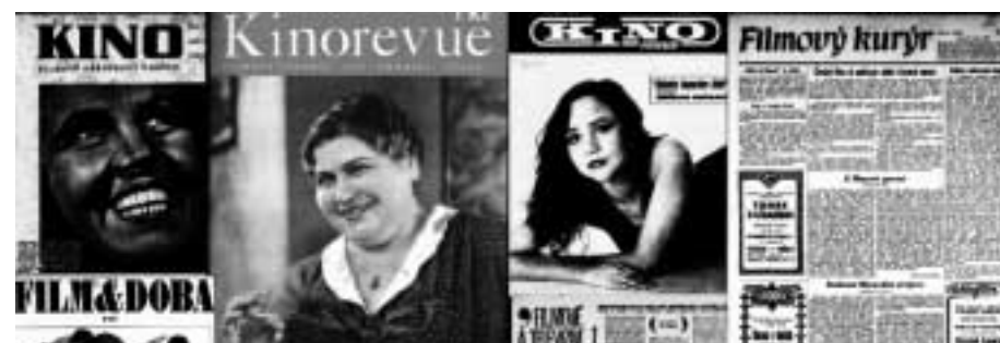
Ukázky obálek titulů periodik z digitální knihovny NFA

Prioritou v současnosti je kompletní retrospektivní zpracování fondů z pohledu filmu a jejich zpřístupnění v on-line katalogu knihovny. Zvažovali jsme způsob provedení retrospektivy. Vzhledem k různorodé informační hodnotě katalogizačních lístků jsme nezvolili cestu jejich skenování jako většina knihoven, ale opětovné zpracování s pramenem v ruce. Počet knihovních jednotek knihovny se dnes pohybuje okolo 110 000. Podrobný věcný popis dokumentů má pro obor filmu klíčový význam. Selekčním termínem se stává každé slovo z popisu. Díky retrospektivě objevujeme zapomenuté tituly, které by v katalozích nikdy nebyly nalezeny a zároveň podrobně mapujeme fyzický stav fondu, který během své historie zažil řadu přesunů. Sbírkové scénářů a separátů osobností jsou již kompletně zpracovány. Retrospektivní katalogizace sbírky separátů filmů se blíží ke konci. Fond knih a periodik je zpracován na 45 %. Vše je zpřístupněno veřejnosti v on-line katalogu včetně napojení na databázi filmových autorit (film, personálie, korporace, akce, hesla).