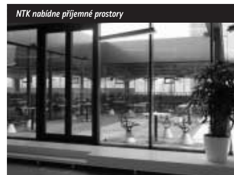
NTK nabídne příjemné prostory

Dnes se více než dřív uplatňuje v knihovnách i kolem nich zeleň. Vedle estetického a psychologického účinku mohou rostliny v knihovně ovlivňovat příznivě i klima, ale jejich hlavní role je v okolí budovy, ať jde třeba o veřejný park nebo zahradu