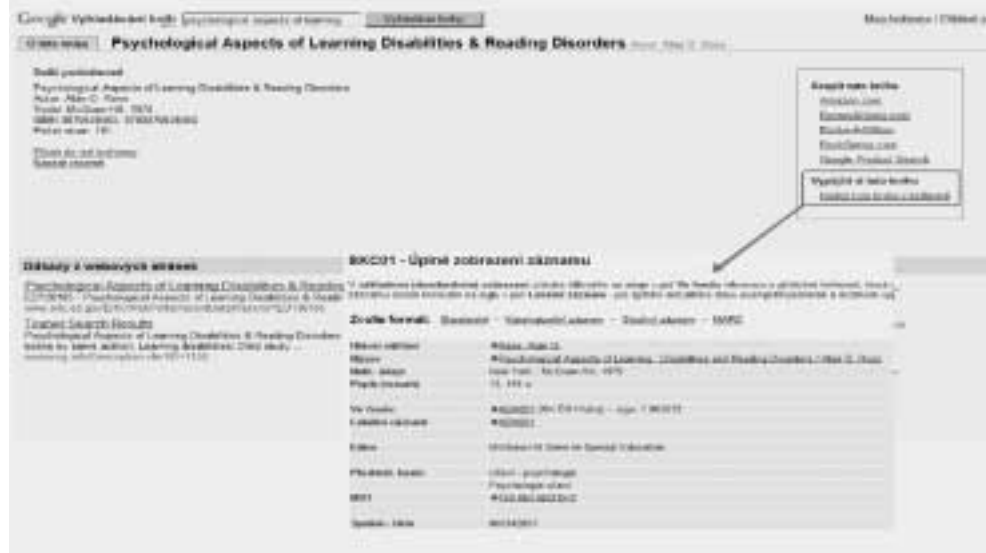
Obr. č. 5 Odkaz z Googlu na katalog knihovny

Knihovny a další informační instituce stále ve větší míře využívají zdroje mimo svou oblast, tedy ty, které jsou volně či s licencí zpřístupněny na internetu. Pracoviště knihoven musí tyto zdroje zahrnout do svých pracovních postupů a pokusit se „vytěžit“ z těchto aktivit maximum z hlediska svého zaměření či služeb. Knihovny jsou po staletí vnímány jako místa zpřístupňování tištěných dokumentů, jako místa pro klidné studium knihy nebo periodika. S rozvojem a využíváním moderních informačních a komunikačních technologií však stále více využívají informace vzniklé mimo jejich spolupráci a také se zaměřují v nabídce svých služeb i na ty uživatele, kteří knihovnu nevyužívají standardně, tedy na ty, kteří ji navštíví pouze nahodile, omylem či dokonce vůbec ne. Právě tyto nové služby jsou příklady moderního řešení zpřístupnění informačních zdrojů. Pro jejich další rozvoj je však důležité nejen trvale rozšiřovat počet využívaných/zpřístupňovaných zdrojů a služeb, ale i navázat komunikaci s koncovými uživateli a rozvíjet je dále ve vzájemné spolupráci.