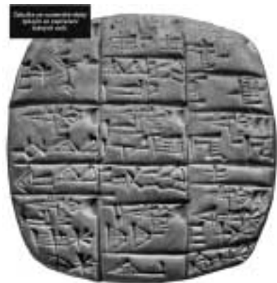
Klínové písmo v Mezopotámii

tel i dlužník – dostali každý jednu polovinu se souhlasnými vrubky. Dodnes se u nás říká pro obrazné vyjádření nějakého spíše symbolického dluhu „ten má u mne vrubek“.