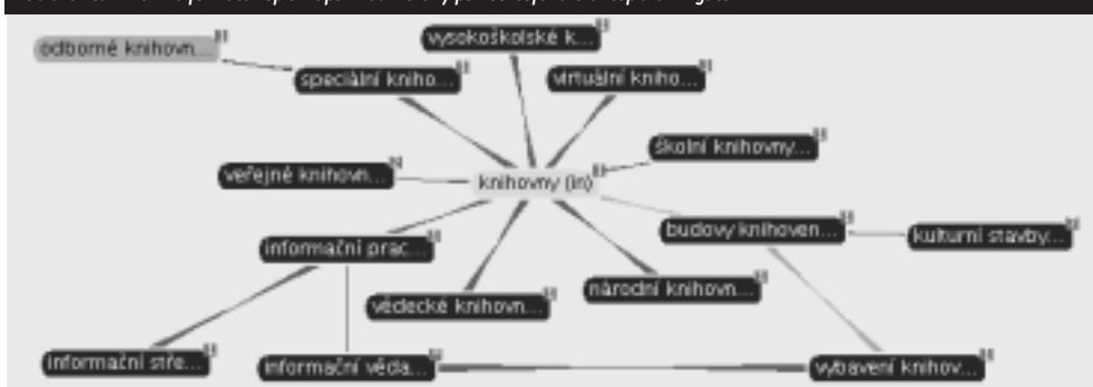
Obrázek č. 1 PSH ve formátu Topic Maps vizualizovaný pomocí software Ontopia Omnigator

Zatímco folksonomie je tvořena volně bez daných pravidel, hierarchie a řádu, taxonomie, v našem případě PSH, představuje předem vytvořenou kategorizaci pojmů. Kombinací PSH a folksonomií bychom mohli využít nevýhody jednoho přístupu ve prospěch druhého a naopak.