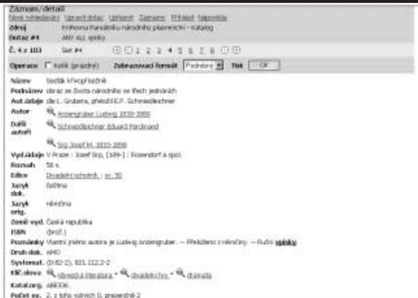
Obr. č. 1 Zachycení vpisků v bibliografickém záznamu elektronického katalogu Knihovny Památníku národního písemnictví

spisovatele a knihovníka Jiřího Mahena (465 sv.), literárního vědce a překladatele Václava Černého (1210 sv.), malíře a karikaturisty Adolfa Hofmeistersera (803 sv.), překladatele a literárního historika Pavla Eisnera (1847 sv.), slovenského spisovatele Ladislava Mňačka (1847 sv.), spisovatele Aloise Jiráska (11 100 sv.), básníka Vítězslava Nezvala (2111 sv.), předního českého filozofa Jana Patočky (527 sv.), básníka Vladimíra Holana (2855 sv.) a estéta a básníka Jiřího Karáska ze Lvovic (více než 40 000 sv.).