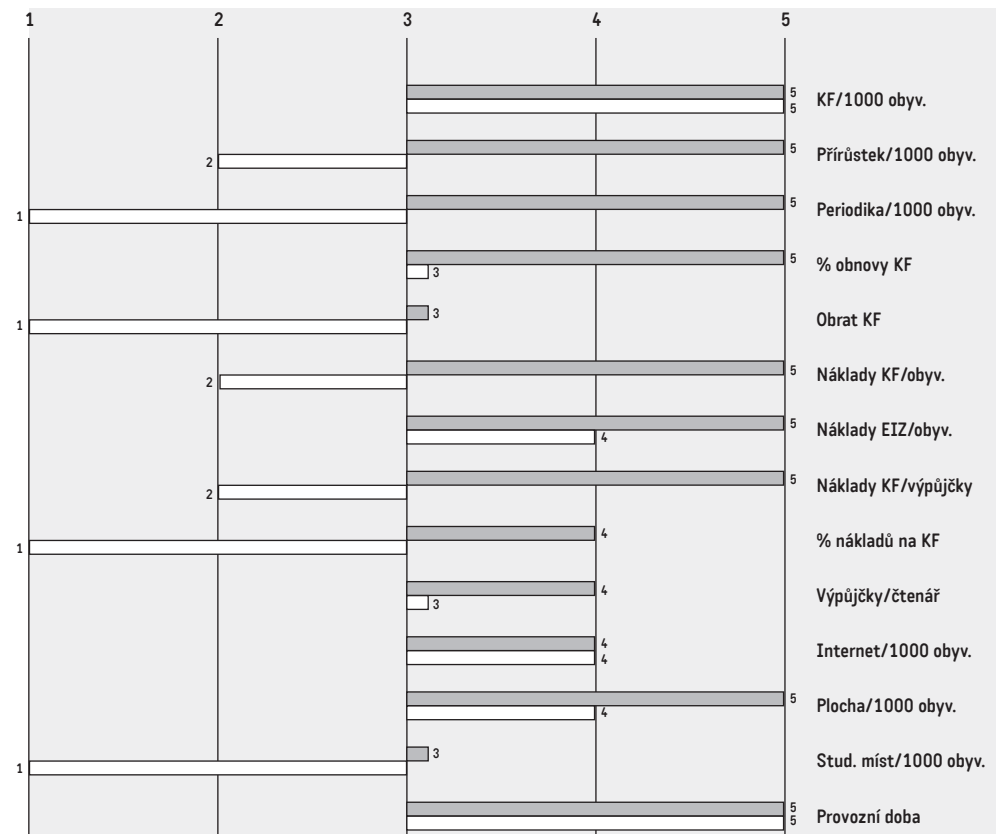
Obr. č. 3. POROVNÁNÍ DVOU KNIHOVEN V GRAFU

Proces benchmarkingu je založen především na porovnávání kvantitativních (statistických) údajů, které různým způsobem dokládají výkony a činnosti knihovny. Kvantitativní údaje jsou dobrým východiskem pro vzájemné srovnávání, ale z vlastní zkušenosti víme, že jejich vypovídací možnosti mají svá omezení, protože v řadě případů nejsou schopny odlišit rozdílnost funkcí, které jednotlivé knihovny vykonávají a v jakém společenském či územním kontextu působí. Z tohoto důvodu jsou od knihoven získávány další údaje, které blíže osvětlují jejich konkrétní činnost. Pro tento účel knihovny zúčastněné v projektu vyplňují stručný dotazník, který zahrnuje následující body: