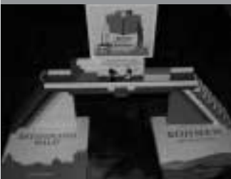
Bücher bauen Brücke – Knihy staví mosty mezi knihovnami i mezi národy

V pátek 24. října loňského roku navštívili zástupci Městské knihovny Klatovy svou partnerskou knihovnu v německém Chamu, kde tento den vyvrcholil projekt „Bücher bauen Brücke“ (Knihy staví mosty). Touto návštěvou byla zároveň prohloubena vzájemná spolupráce mezi oběma knihovnami, která se datuje od předchozího podzimu. Dne 1. října 2007 jsme totiž v Klatovech mohli v rámci Týdne knihoven , který tenkrát probíhal pod heslem „Týden bavorské kultury“, uvítat delegaci z Chamu a další významné hosty.